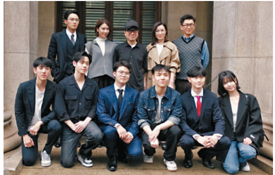
●《正義女神》劇組昨日拍攝番外篇。

另一個樣，有多種人格，是工作狂同時也「爛玩」。對於被形容為「爛玩」，阿余認為沒所謂：「我覺得Work hard, play hard, 好多時做嘢壓力好大，做嘢時候好認真，玩嘢時候都可以好認真，可以釋放壓力，適當地玩。」阿余指今晚劇組都在深圳可以相約聚餐，更笑言要嘉洛請客，嘉洛即大方答應：「梗係我請！」