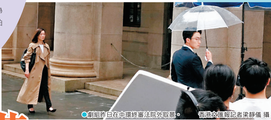
●劇組昨日在中環終審法院外取景。香港文匯報記者梁靜儀攝