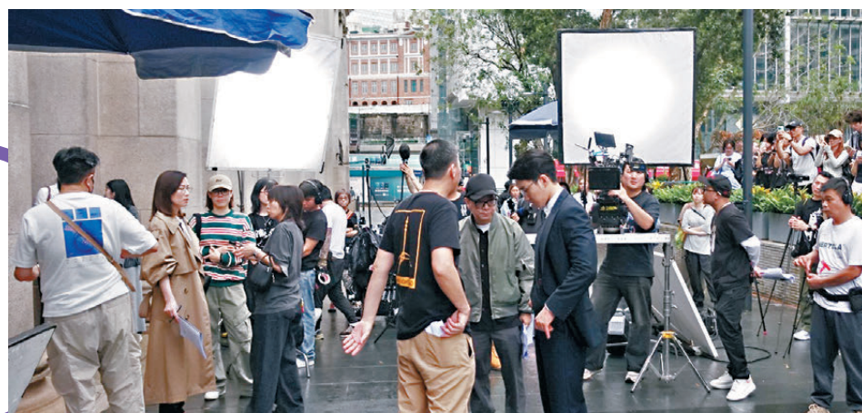
●拍攝現場吸引大批市民冒雨圍觀。

阿余以劇中眼鏡造型現身中環拍攝，透露今次番外篇於《正》劇拍畢後已知道會拍攝，共拍攝3天，完成香港拍攝後，隨後兩日會到深圳拍攝。雖然劇集拍竣多時，但阿余指回憶和感覺返過來，很難得又見返同一班合作夥伴。