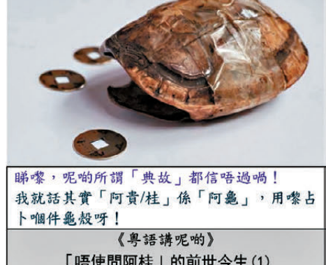
睇嚟，呢啲所謂「典故」都信唔過喇！我就話其實「阿貴/桂」係「阿龜」，用嚟占卜咩咩咩呀！

廣東人有個口頭禪：唔使問阿桂 也有寫成：唔使問阿貴 在未述說其「前世今生」之前，我們