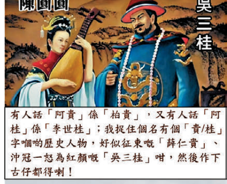
睇嚟，呢啲所謂「典故」都信唔過喇！我就話其實「阿貴/桂」係「阿龜」，用嚟占卜咩咩咩呀！