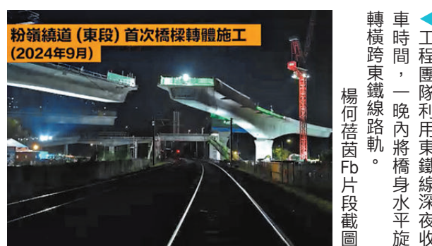
▲工程團隊利用東鐵線深夜收車時間，一晚上將橋身水平旋轉橫跨東鐵線路軌。