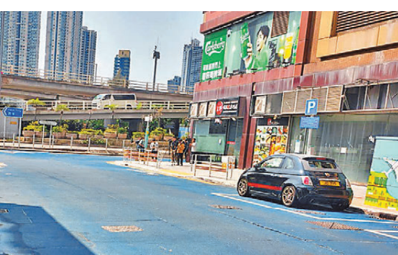
●市建局團隊選用藍色防滑鋼砂重鋪車路，營造天空投射在地面的視覺效果。

市建局將「3B」體系引入「龍城」，透過改善已建成環境、加強社區連結及優化地區經濟三大元素的互動協作，進一步凸顯地區特色，促進城市新