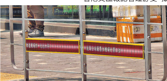
●在行人路旁的欄杆增設「舊機場航班資料顯示牌」為設計靈感的藝術裝置，向訪客介紹潮泰文化、舊機場相關資訊和歷史。

貌，帶動人流並提振經濟，從而推動地區持續發展，構建有溫度的市區更新。除了在潑水節前完成一系列街區美化工程外，市建局去年亦推行多項地方營造活動以加強地區特色、吸引人流並創造商機，包括與本地藝術設計團隊合作，為「小區復修」範圍內約40間地舖設計及安裝具「龍城」特色的燈牌裝飾；另與中國美術學院合作，以潮泰融合的獨特文化、舊啟德機場和九龍城為靈感，於九龍城龍崗道、打鼓嶺道及買炳達道，設置「啟德歲月」、「潮泰狂舞曲」、「城寨魔方」三個AR(擴增實境)「打卡」熱點，透過藝術科技讓訪客感受「龍城」的歷史與文化。