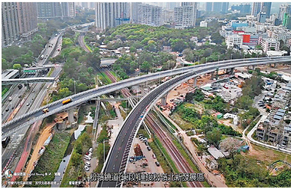
●粉嶺繞道(東段)全長約4公里，是北部都會區發展中首個落成的大型運輸基建項目。

香港文匯報訊 國家「十五五」規劃綱要首次把「加快北部都會區建設」納入國家規劃的層面，特區政府全力提速提效發展北部都會區及相關基建，當中全長約4公里粉嶺繞道(東段)，是首個落成的大型運輸基建項目，主體工程由展開至完成歷時6年，預計將於本月底或5月初開通。該主體工程的一大突破，是土木工程拓展署(土拓署)工程團隊以創新思維及開放態度，借鑑內地橋樑建造技術和經驗，在全港首次採用「橋樑轉體施工技術」，用兩個晚上完成轉體跨越港鐵東鐵線的兩段行車橋的建造工程，達到縮工期、降成本和提升施工安全性的創新成果。