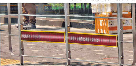
●在行人路旁的欄杆增設以「舊機場航班資料顯示牌」為設計靈感的藝術裝置，向訪客介紹潮泰文化、舊機場相關資訊和歷史。

貌，帶動人流並提振經濟，從而推動地區持續發展，構建有溫度的市區更新。除了在潑水節前完成一系列街區美化工程外，市建局去年亦推行多項地方營造活動以加強地區特色、吸引人流並創造商機，包括與本地藝術設計團隊合作，為「小區復修」範圍內約40間地舖設計及安裝具「龍城」特色的燈牌裝飾；另與中國美術學院合作，以潮泰融合的獨特文化、舊啟德機場和九龍城為靈感，於九龍城龍崗道、打鼓嶺道及買炳達道，設置「啟德歲月」、「潮泰狂舞曲」、「城寨魔方」三個AR(擴增實境)「打卡」熱點，透過藝術科技讓訪客感受「龍城」的歷史與文化。