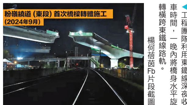
▲工程團隊利用東鐵線深夜收車時間，一晚上將橋身水平旋轉橫跨東鐵線路軌。 楊何蓓茵 Fb 片段截圖