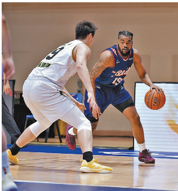
●美臣鍾斯在比賽中。

隨着總決賽戰幔即將揭開，香港金牛將全力備戰，力爭在主場球迷支持下再創佳績，並衝擊成為NBL史上首支達成三連霸的球隊。