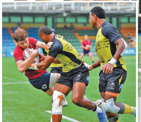
●港隊積極備戰，下周將與西班牙隊寓賽於操。

男子港隊將在銀劍賽面對國家隊與日本的強力挑戰，力爭三連霸；而衛冕的女子隊則會迎戰泰國與丹麥。