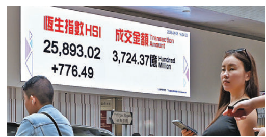
●恒指昨日漲超700點。

顯著反彈，港股亦有望受惠。該行續指，從技術走勢分析來看，恒指只要能企穩250天線（25,141點），則後市整體走勢仍然樂觀，有望重上26,000點水平。