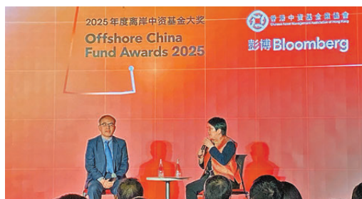
●財庫局局長許正宇（左）指出，香港在IPO及監管方面雖表現出色，但仍須不斷提升競爭力及金融基建。