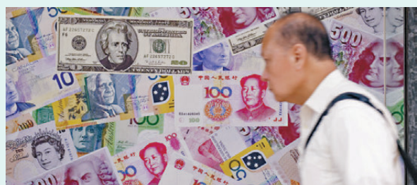
●分析師指出，在戰爭明顯緩和前，美元仍可能保持偏強，非美元貨幣整體仍然承壓，但人民幣在當中相對具韌性。資料圖片

會上指出，今年以來宏觀政策更加積極有為，貨幣政策保持適度寬鬆，強化逆週期和跨周期調節，要綜合運用多種貨幣政策工具，為經濟持續向好向優創造適宜的貨幣金融環境。