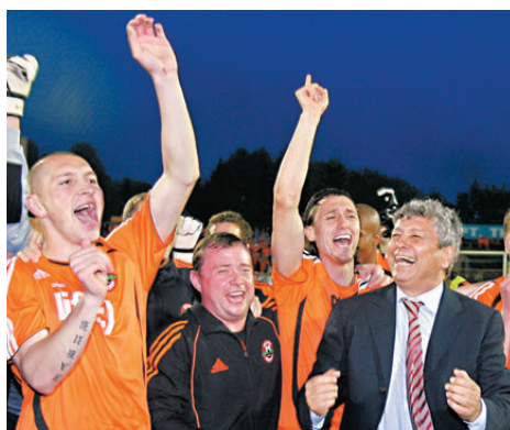
●盧錫斯古（右）因病離世。

在盧錫斯古病逝消息傳出後，一眾球壇人士紛紛致哀，其中前羅馬尼亞球王赫傑表示：「羅馬尼亞足球史上最偉大的其中一位傳奇離開了我們，盧錫斯古是世界球壇的傳奇人物，一直讓我們感到無比自豪。」