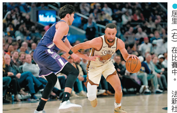
●居里（右）在比賽中。

另一方面，熱火昨日以95：121不敵連龍，賽後累積41勝38負，肯定無緣直入季後賽，要通過附加賽逐逐季後賽席位，這亦是熱火連續第四年征戰附加賽。