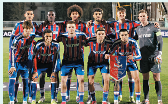
●水晶宮力爭先下一城。

至於費倫天拿近況雖然回勇，已錄得六場不敗，不過球隊目前於聯賽僅領先降班區的萊切五分，面對作客劣勢，要分心護級的費倫天拿難免處於下風。而且水晶宮防線一向以嚴密硬朗見稱，費倫天拿中鋒摩斯堅恩勢將孤掌難鳴，要射破水晶宮大門並非易事。