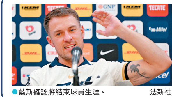
●藍斯確認將結束球員生涯。