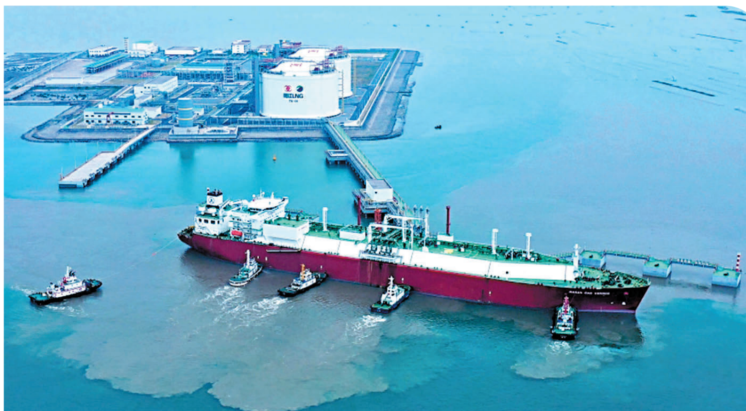
●中國正加快構建天然氣戰略版圖。圖為位於粵西地區的陽江LNG調峰儲氣庫項目。