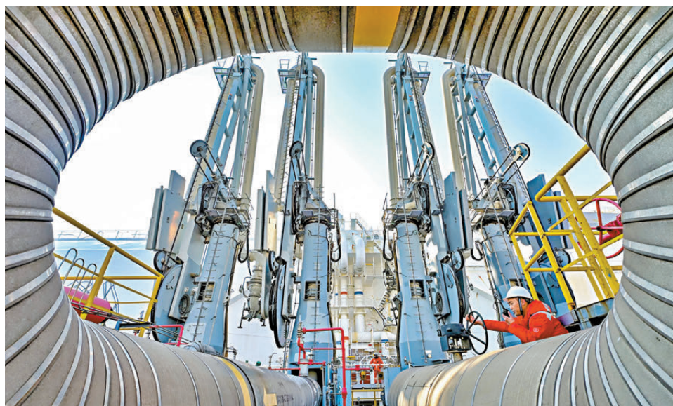
●工人日前在國家管網天津LNG接收站碼頭巡檢。