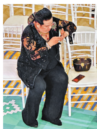
●Ball場首項規則：衣裝華麗，珠寶氣擺。

何嘗不夜夜笙歌？ 跟娛樂版有別，報刊雜誌曾劃出特別篇章報道娛樂名人活動。忽爾消逝，Ball場風氣消失殆盡，跟政治或經濟無關，乃是去慣了、去厭了。 筆者在這種怠惰現象出現之前，某夜正襟危坐置名人堆中間，大型活動的酒店食物難吃早非新聞，幾乎天天在名人版見報名人們的話題：帶着名牌衣裳飛去羅省？倫敦？巴黎？還是蘇黎世乾洗服務比較周到？ 在下無禮，呼呼入睡，醒來驚覺，此後絕跡Ball場。 從「人家」的豪華活動走出來，清風徐來黃昏安靜，回望，任何人物、任何流行事物，必有生命期，完結了，無容可惜。泰國保存着皇室制度，推動着禮儀服裝、珠寶飾物、美容髮膚、餐飲服務等等經濟發展，益惠民間。 其它城市？過了新發財、新富貴歲月，一切隨和，穿着 Casual 過着平淡營生，一切刺激來自網絡，與其他人可斷絕近身來往。