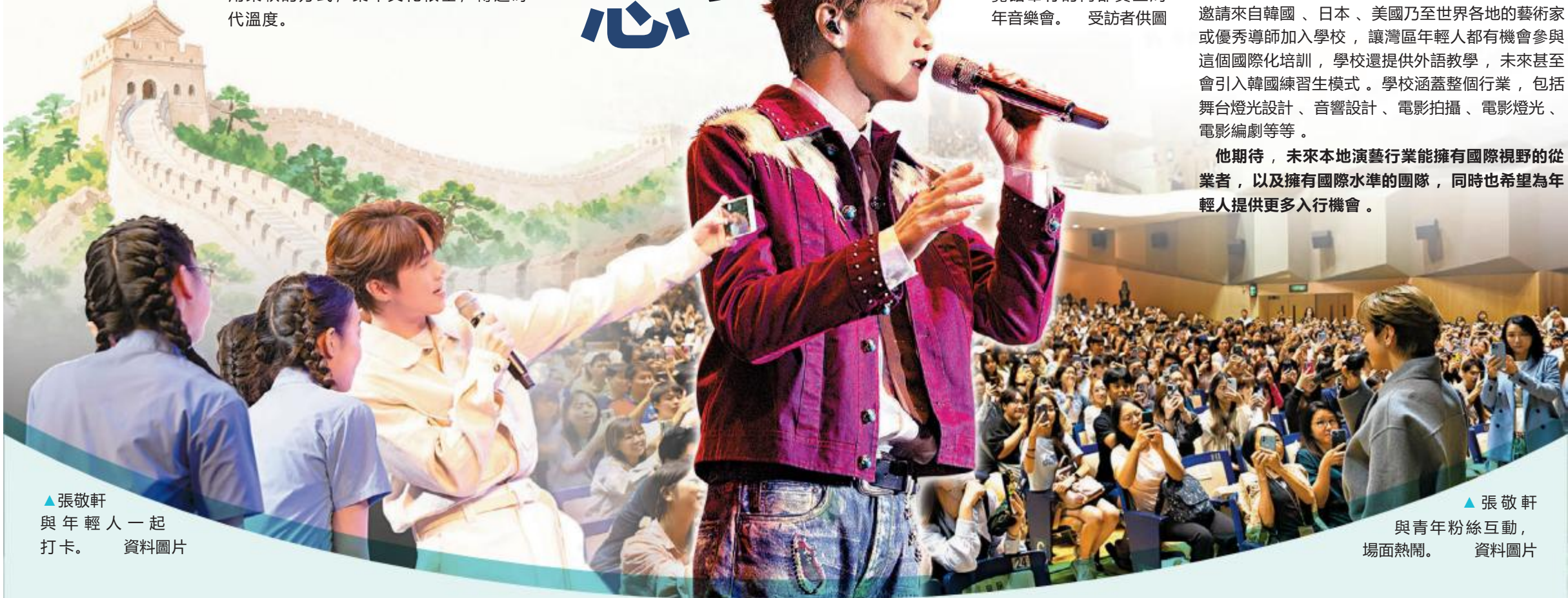
▲張敬軒與年輕人一起打卡。

除了擔任項目導師，張敬軒還透露，會繼續透過不同計劃，以及自己的演藝訓練學院，培養更多演藝新力量。「我一直都希望能夠透過文藝作品及自己的公眾影響力，鼓勵和支持更多年輕人為國家和為香港未來的發展作出積極的貢獻。我會繼續透過個人演藝訓練學院，培養演藝新力量，引領他們了解，進而推廣優秀中華文化；熱心參與愛國主義教育相關活動；以及投身大灣區建設，促進文化交流等。」他表示，希望自己不只是個唱歌的歌手，更能成為年輕人的人生導師——用柔軟的方式，築牢文化根基，傳遞時代溫度。