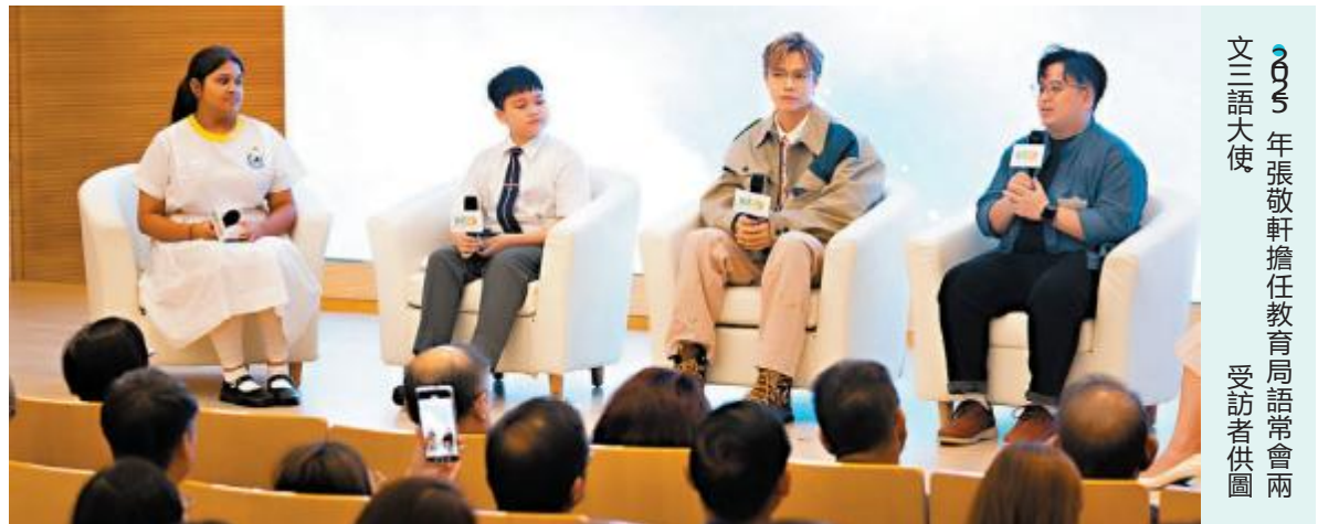
2025年張敬軒擔任教育局語常會兩文三語大使

香港文匯報訊（記者 崔滢）隨着國家「十五五」規劃提出激發全民族文化創新活力、推動文化產業、提升中華文明傳播的影響力，張敬軒決定用自己的方式貢獻力量——創辦一所涵蓋台前幕後的演藝學院，從舞台燈光、音響設計到電影編劇、韓國練習生模式，他希望讓大灣區的年輕人都能接受國際化培訓，把香港打造成真正的演藝文化中心。