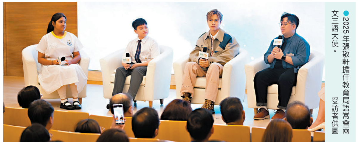
●2025年張敬軒擔任教育局語常會兩文三語大使。

香港文匯報訊（記者 崔滢）隨着國家「十五五」規劃提出激發全民族文化創新活力、推動文化產業、提升中華文明傳播的影響力，張敬軒決定用自己的方式貢獻力量——創辦一所涵蓋台前幕後的演藝學院，從舞台燈光、音響設計到電影編劇、韓國練習生模式，他希望讓大灣區的年輕人都能接受國際化培訓，把香港打造成真正的演藝文化中心。