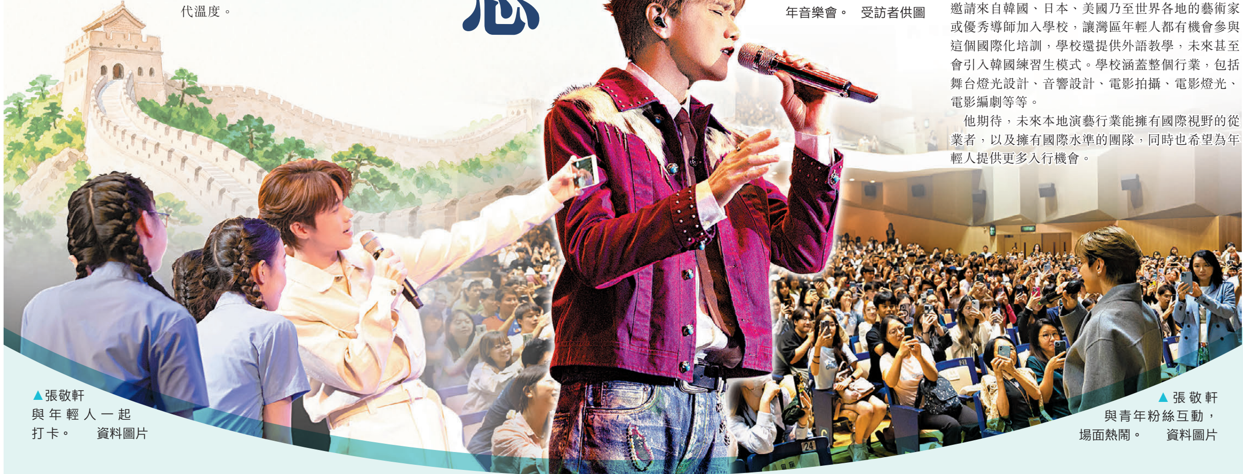
▲張敬軒與年輕人一起打卡。資料圖片

除了擔任項目導師，張敬軒還透露，會繼續透過不同計劃，以及自己的演藝訓練學院，培養更多演藝新力量。「我一直都希望能夠透過文藝作品及自己的公眾影響力，鼓勵和支持更多年輕人為國家和為香港未來的發展作出積極的貢獻。我會繼續透過個人演藝訓練學院，培養演藝新力量，引領他們了解，進而推廣優秀中華文化；熱心參與愛國主義教育相關活動；以及投身大灣區建設，促進文化交流等。」他表示，希望自己不只是個唱歌的歌手，更能成為年輕人的人生導師——用柔軟的方式，築牢文化根基，傳遞時代溫度。