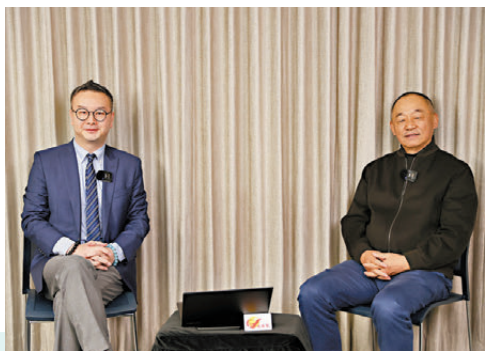
●HashKey集團董事長兼首席執行官肖風接受《經濟論》主持陳澤銘訪問。