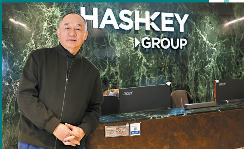
●HashKey集團董事長兼首席執行官肖風