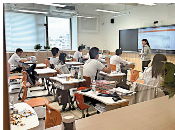
●圖為學生在新校區上課。

天科技等科技企業合作，將企業真實課題轉化為學生項目，每學期提供超過 70 課時科技課程。在開校儀式上，「亞洲飛人」蘇炳添向學校贈予 9 秒 83 打破亞洲紀錄的簽名戰衣，以「突破極限、追求卓越」的體育奮鬥精神激勵學子勇攀高峰。