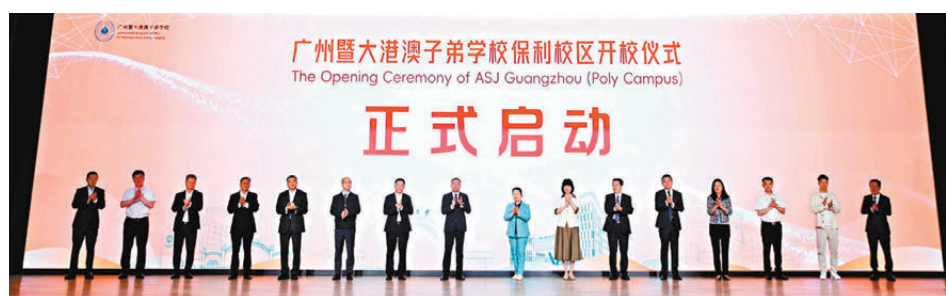
●廣州暨大港澳子弟學校海珠保利校區正式開校啟用。

記者在走訪中看到，新校建築風格鮮明，校舍通達寬敞，功能場地多，包括國家級標準游泳館、室內多功能體育館、空中田徑場，以及「1+8 科技實驗室集群」，學校亦設有廣州首個中小學擊劍練習場，期望為大灣區培養專業體育人才。譚日旭表示，過去五年，學校推動粵港澳基礎教育與國際課程融合，期望新校區能進一步回應國家及灣區發展對創才的需求。