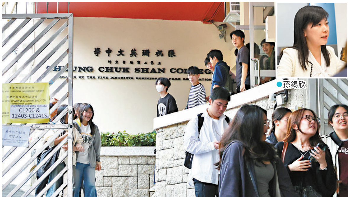
●香港中學文憑試英文科閱讀及寫作卷考試昨日舉行。

形容詞及文學語言，對考生來說或非常陌生。但她在監考期間觀察到不少考生靈活應對，「選擇先完成其他文章，最後才返回處理詩歌部分。」雖然詩歌用字內容較深，但其主題及題目要求也未有特別艱深，相信考生若能花多些時間做好文本理解，應該仍有較高機會得分。