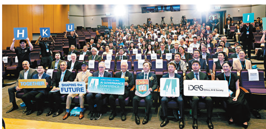
●香港大學主辦「香港全球人工智能治理峰會 2026」，推動跨學科與跨地域對話。

香港文匯報訊 (記者 史柳藝) 人工智能 (AI) 正以前所未有的速度重塑社會、教育與產業格局，並帶來前所未有的治理挑戰，香港作為國際創科中心，在這方面肩負着推動全球 AI 對話與合作的關鍵角色。香港大學同心基金數據科學研究院昨日起一連兩天舉辦「香港全球人工智能治理峰會 2026」，匯聚來自世界各地的學者、政策制定者及業界領袖，推動具國際視野且兼顧多元觀點的交流，首日參與者逾 400 人。其中在主題對談環節，專家們聚焦新一代作為「AI 原住民」，所帶來的教育與培養挑戰，又特別指出目前全球各地接觸 AI 的機會並不均等，如何縮減差距成為未來 AI 治理的重要課題。