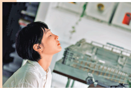
●《春樹》是個悲傷的故事。