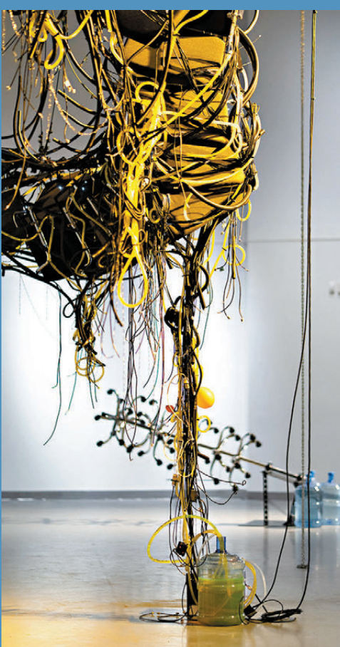
●辦公室元素在展覽的各處細節展現。