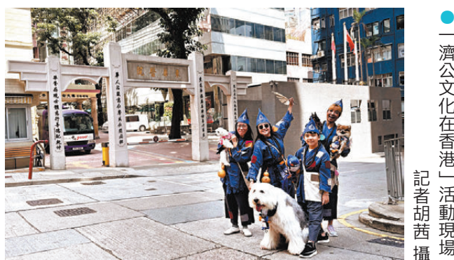
●「濟公文化在香港」活動現場