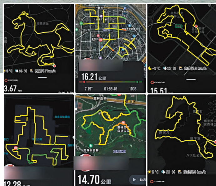
●社交平台上隨處可見各種各樣造型的「馬」。

在觀景平台駐足小憩，可遠眺濕地碧波與岸邊花海。走到林間空地時，為了精細畫出「2026」字樣，參與者往往放慢腳步，反覆折返。在停頓間隙，他們欣賞身邊春日景致：嫩草頂着露珠，不知名的小紫花點綴草叢，高大喬木抽出新葉，一派生機勃勃。