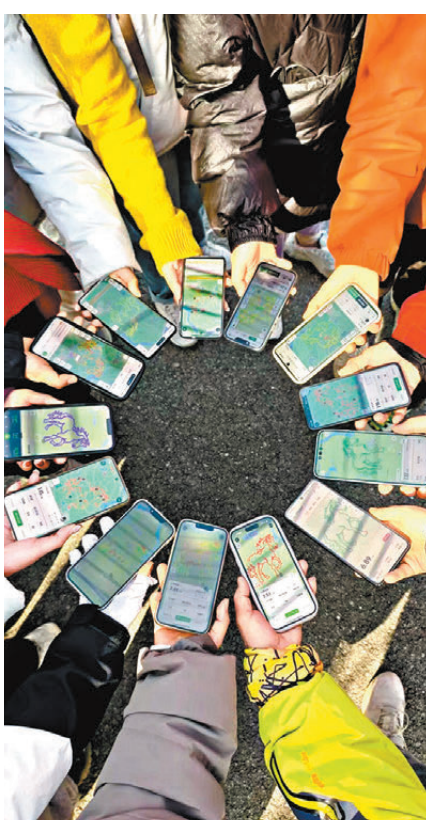
●年輕人紛紛加入「畫馬」行列。

廣州的春日暖意融融，木棉花傲然綻放，火紅花朵綴滿枝頭，成為城市最亮眼的風景。年輕人沿着珠江邊前行，「畫馬」的軌跡串聯起珠江新城、小蠻腰與濱江公園。江風拂面，帶着濕潤水汽，岸邊籟籟盛放，姹紫嫣紅，與江水湛藍相得益彰。