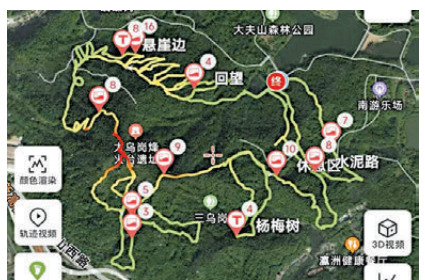
●城市「畫馬」的風吹到了廣州，這是網友在廣州大夫山森林公園「畫馬」後的作品。

桐抽出新葉，嫩綠枝葉層層疊疊，陽光透過枝葉灑落路面。年輕人沿着復興路、武康路前行，「畫馬」的軌跡串聯起老洋房、咖啡館與街邊小店。路邊的玉蘭花競相綻放，潔白花瓣綴滿枝頭，與老洋房的紅磚相映成趣。