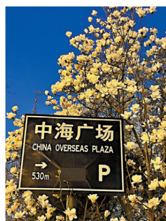
●萬物復甦，北京城裏一派春日景象。

「畫馬」活動讓原本熟悉的公園步道煥發出全新的趣味，跑者們不再只是機械地重複圈數，而是為了完成一幅作品而精心計算步幅與角度。這匹馬定格了風的流向，記錄了光的溫度，也將年輕人對生活的熱愛具象化為地圖上一抹靈動的色彩。