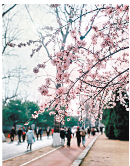
●奧森公園春色浪漫，吸引人們紛紛前往。

勾勒出駿馬的頭部，再折向東南，前往水邊觀景平台。這段最長的軌跡線，恰好串聯起奧森最動人的春日盛景。