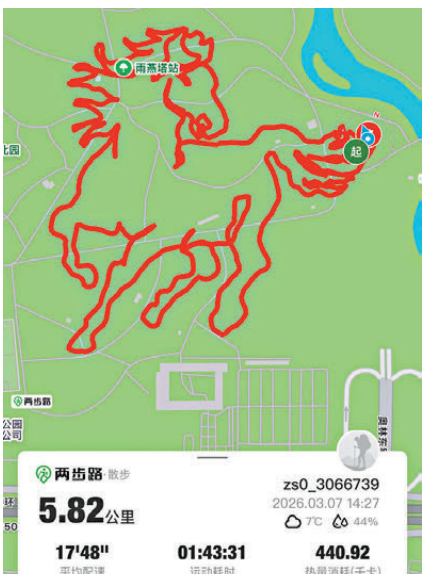
●借助運動App的軌跡記錄功能，年輕人在城市公共空間裏用腳步「繪製」出一匹匹奔騰的駿馬。在奧森公園裏，「雨燕塔」是其中一個站點。

水鳥掠過，留下一圈圈漣漪，行走間，宛如置身畫中。也有資深愛好者挑戰「馬頭+2026」的創意路線，他們一路向北，曲折走到雨燕塔站，勾