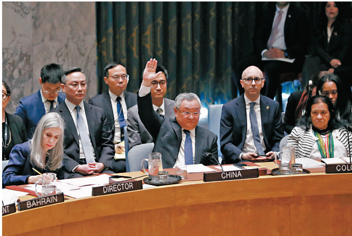
●「玉淵譚天」長文披露中方行使否決權三方面考量。圖為當地時間4月7日，在位於紐約的聯合國總部，中國常駐聯合國代表傅聰（前排中）在安理會就一項涉及霍爾木茲海峽的決議草案進行表決時投反對票。

這次草案的焦點——霍爾木茲海峽。作為重要的國際能源貿易通道，維護其安全暢通符合國際社會共同利益，各方圍繞海峽通航提出草案無可厚非。但在此過程中，海灣國家的主權、安全和領土完整應得到充分尊重。 海峽問題，說到底是當前衝突的外溢。因此，解決問題的根本，還是盡快推動停火止戰，讓局勢整體降溫。 最後，「玉淵譚天」指出，對中東地區國家而言，唯有增強戰略自主，增進政治互信，才能迎來真正的和平。和平的答案，從來不在強權的軍事行動裏，而在對主權的尊重裏，在促膝長談的對話裏，在向戰亂說「不」的抉擇裏，「這也是中國行使否決權的答案。」