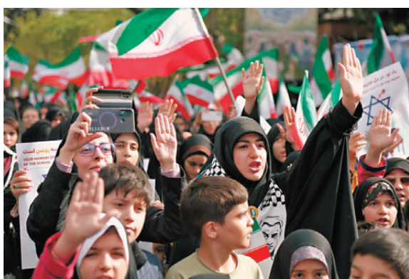
●當地時間4月7日，伊朗民眾在德黑蘭集會，悼念遭美以空襲遇難的米納卜小學學生。

過去一段時間，中國做的是多方的工作，並沒有單獨針對某個國家，而是兼顧了多方關切。首先要看到，在整場衝突中，中方始終是不偏不倚的。在停火達成前幾個小時，聯合國安理會審議了一份由巴林牽頭提交、涉及霍爾木茲海峽的決議草案。除了巴林，科威特、卡塔爾、沙特、阿聯酋等海灣國家也在提案國之列。中國行使了否決權。