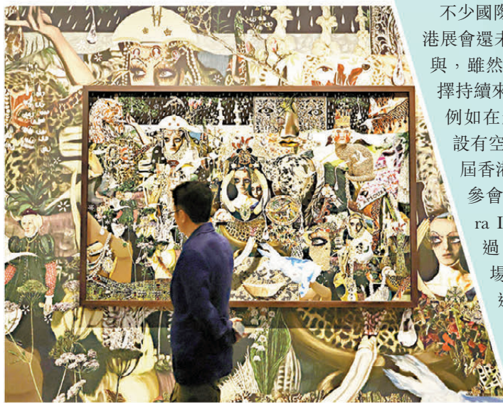
● Lal Batman 的作品成為展區一獨特景色。