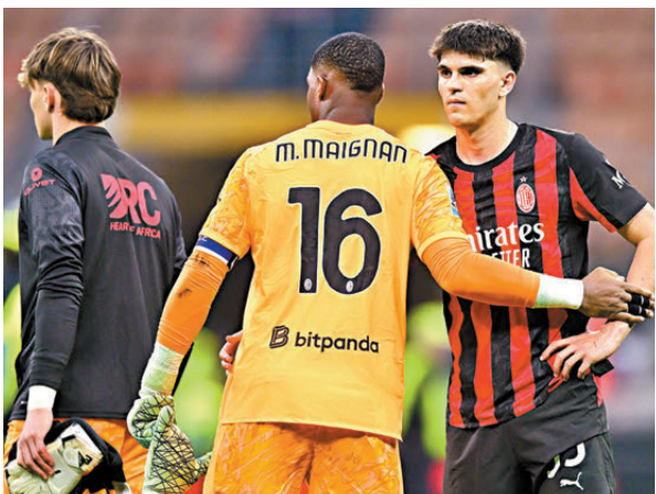
●AC米蘭球員表現令人失望。

同日比賽，祖雲達斯作客憑謝利美保格一箭定江山，作客以1:0勇挫阿特蘭大。祖雲達斯賽後32戰累積60分，追至僅落後A米三分，仍大有機會爭逐來季歐聯入場券。