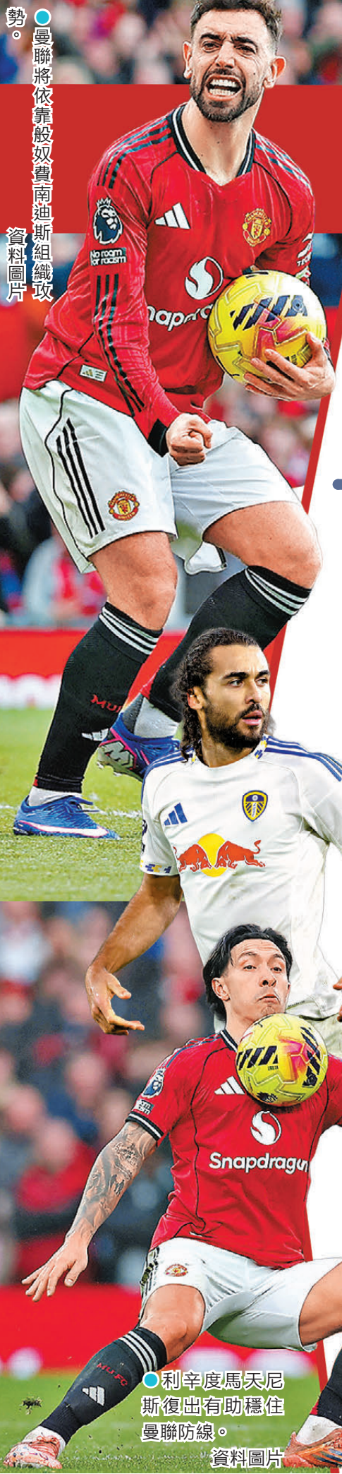
曼聯將依靠般奴費南迪斯組織攻勢。