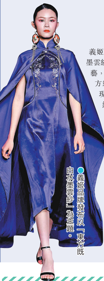
●義姬品牌發布以「東方既白 水墨雲紗」為主題。

「東方既白」象徵東方美學在新時代的覺醒與綻放，「水墨雲紗」則是香雲紗與水墨意境的完美交融。傳統工藝並非塵封的歷史，而是能融入現代生活的時尚基因。透過持續的設計創新與匠心堅守，讓香雲紗這一非遺瑰寶走出時光，成為連接傳統與現代、東方與世界的時尚紐帶。