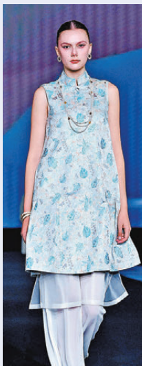
●「蝶舞芳華」系列以東方美學中經典的蝴蝶意象為靈感。

自然界的生命律動轉化為衣袂間的當代語言，致敬女性如花盛放、破繭而出的內在芳華。設計師秉持「以衣為境」的創作初心，在自然材質與靈動蝶影之間，詮釋女性由內而外的舒展與光芒。不逐潮流，不困形制，讓每一件作品成為身心自在的載體，於動靜之間盡顯芳華氣韻。 品牌堅持非遺活化與當代實穿並重，讓面料成為文化的載體，讓剪裁成為時代的表達。本季「宋錦·漳絨緞」系列多用於外套及結構性單品，透過現代廓形重塑線條，賦予傳統織錦新的視覺張力，挺括而不失溫婉。漳絨緞以立體絨花與浮雕質感，讓古典韻在當代身形上靈動流轉，承載東方書卷氣與儀式感。