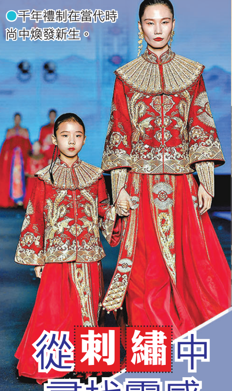
●千年禮制在當代時尚中煥發新生。