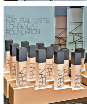
●自然霧光持久粉底液系列