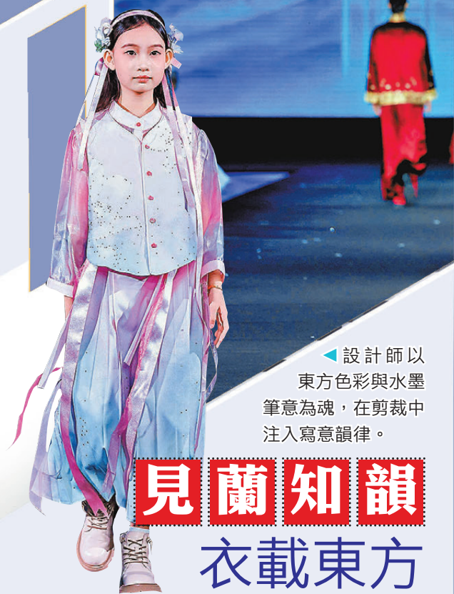
▲設計師以東方色彩與水墨筆意為魂，在剪裁中注入寫意韻律。