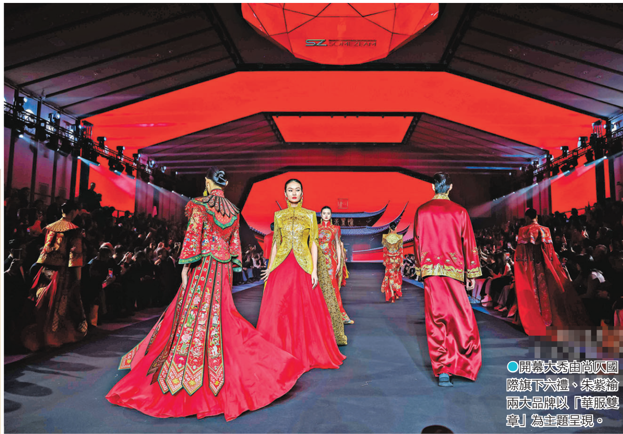
●開幕大秀由尚仄國際旗下「六禮」、「朱紫綸」兩大品牌以「華服雙章」為主題呈現。

開幕大秀由尚仄國際旗下「六禮」與「朱紫綸」兩大品牌以「華服雙章」為主題，深挖中華服章禮制的深厚底蘊，將古代服飾的紋樣規制與現代剪裁相結合。刺繡禮服上金線繡就的雲雷紋層層疊疊，既延續了古代帝王禮服的莊重華貴，又融入了現代時裝的簡約利落，讓千年禮制在當代時尚中煥發新生。設計師希望透過服裝，讓中華服章文化被更多人看見並傳承。