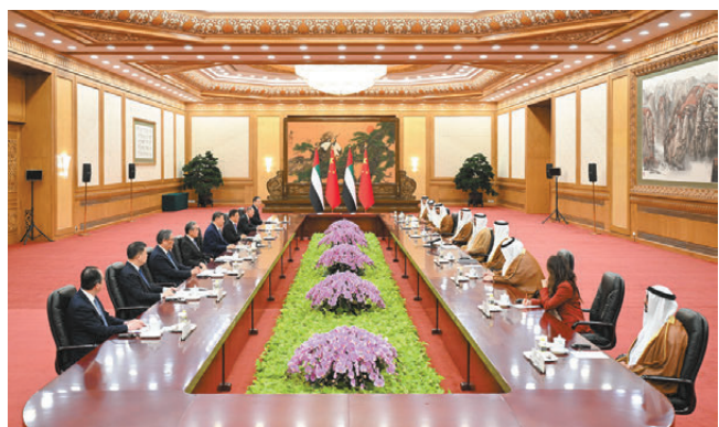
4月14日上午，國家主席習近平在北京人民大會堂會見來華訪問的阿聯酋阿布扎比王儲哈立德。

習近平就維護和促進中東和平穩定提出4點主張：一是堅持和平共處原則。中東海灣國家唇齒相依，是搬不走的鄰居。要支持中東海灣國家改善關係，推動構建共同、綜合、合作、可持續的中東和海灣地區安全架構，築牢和平共處的根基。二是堅持國家主權原則。主權是各國特別是廣大發展中國家安身立命的依託，不容侵犯。中東海灣國家主權、安全和領土完整應當得到切實尊重，各國人員、設施、機構安全應當得到切實維護。三是堅持國際法治原則。維護國際法治權威，不能「合則用、不合則棄」，不能讓世界倒回叢林法則。要堅定維護以聯合國為核心的國際體系、以國際法為