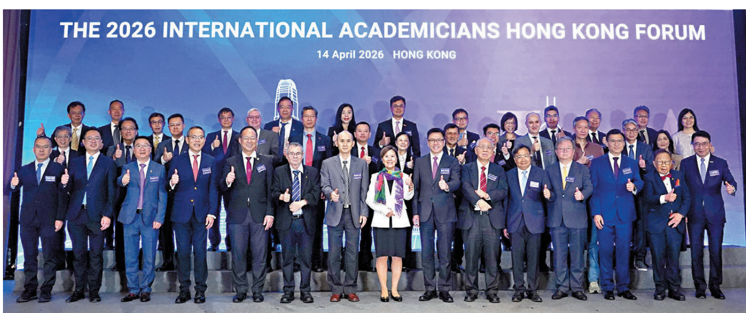
●國際院士香江論壇昨日在港舉行，吸引逾三百人參與。

本屆論壇配合國家「十五五」規劃及香港首個五年規劃的推進，聚焦AI在醫療服務、長者健康管理、大學教學、人才培養及科研合作等領域的最新發展，探討如何推動前沿研究與實際應用對接，深化本地教研機構與國際創新網絡合作。同時，論壇亦致力促進學界、產業與社會之間的持續協作，推動科技與產業創新的深度融合，並擴大創科文化的影響力與公眾參與，回應AI時代下健康與高等教育面對的共同課題。