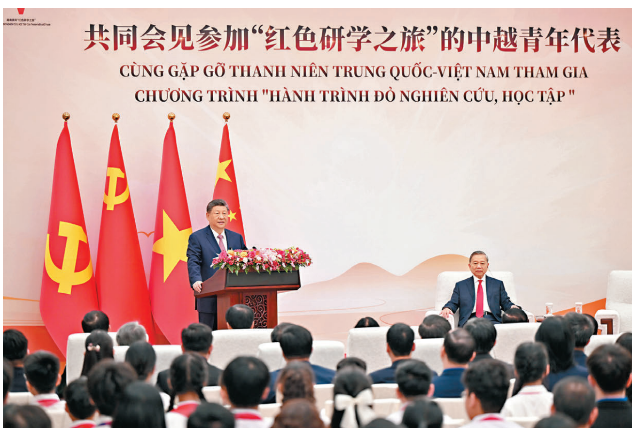
4月15日上午，中共中央總書記、國家主席習近平在北京人民大會堂同來華進行國事訪問的越共中央總書記、國家主席蘇林共同會見參加「紅色研學之旅」的中越青年代表。

香港文匯報訊 據新華社報道，4月15日上午，中共中央總書記、國家主席習近平在人民大會堂同來華進行國事訪問的越共中央總書記、國家主席蘇林舉行會談。習近平在會談中強調，雙方要共同反對單邊主義、保護主義，維護全球自由貿易體制和產業鏈供應鏈穩定暢通，共同應對全球性挑戰。