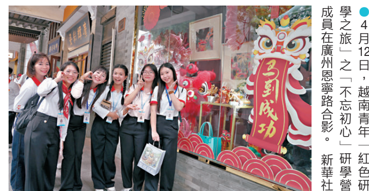
4月12日，越南青年「紅色研學之旅」之「不忘初心」研學營成員在廣州恩寧路合影。