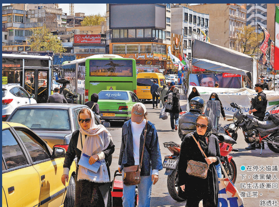
●在停火協議下，德黑蘭人民生活逐漸恢復正常。

美國總統特朗普4月14日表示，美國對伊朗的軍事行動「接近結束」，自己並未考慮延長與伊朗的停火期限，認為此舉沒有必要。美軍中央司令部宣稱，美軍已全面封鎖伊朗港口，完全切斷伊朗海上貿易。伊朗總統佩澤希齊揚稱讚包括中國在內的6國反戰立場，伊朗當局則表示會使用替代港口，繞過美國對霍爾木茲海峽的封鎖。美聯社引述消息人士報道，美伊雙方已「原則上同意」延長將於22日到期的臨時停火協議，以爭取更多外交時間。