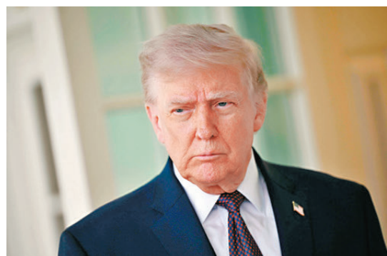
●特朗普稱未考慮延長停火期限。

伊朗總統佩澤希齊揚14日在社媒發文，讚揚中國、俄羅斯、西班牙、土耳其、意大利、埃及6國展現的反戰立場。他稱讚「文明的本質會在關鍵的歷史節點上得以彰顯」，上述6國的立場「源於它們深厚的文化和歷史根基」。佩澤希齊揚還質問美國憑什麼攻擊伊朗，強調伊朗從未尋求動盪，始終遵守國際法，其他人也應遵守同樣的法律。