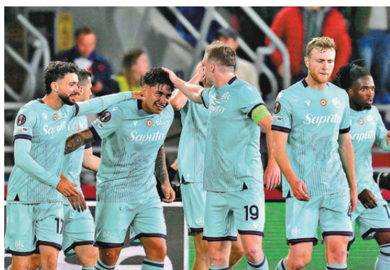
●博洛尼亞防線殘缺，翻身難度極高。 資料圖片