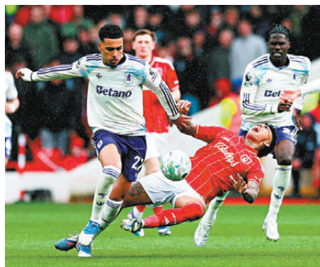
●維拉(白衫)上輪聯賽刻意留力，全力備戰今場大戰。

維拉目前有查頓辛祖、明斯及保巴卡卡馬拉肯定因傷缺陣，上仗賽前受傷的門將達米安馬天尼斯亦上陣成疑，不過球隊陣容仍全方位力壓今場對手博洛尼亞。英格蘭國腳中鋒奧利屈堅斯近況不俗，近四仗攻入三球並交出一記助攻，中場泰利文斯、阿馬度奧拿拿及約翰麥甘尼攻守兼備，再加上進攻重心摩根羅渣士今季大熱大勇，維拉入球能力不成問題。反觀博洛尼亞防線有兩員大將史高盧斯基及祖漢盧古美缺陣，勢難阻擋維拉的強大進攻火力，維拉可望在主場再下一城，繼續向着球會史上首個歐霸盃冠軍邁進。