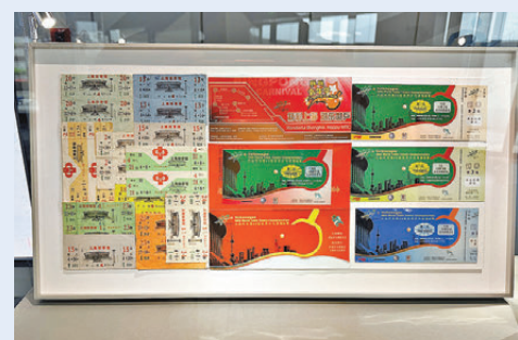
●「萬體館」展示各款老票根。

自此之後的50年間，「萬體館」便數度見證國球榮耀。1980年至1985年，世界冠軍曹燕華每年在此參加紅雙喜公開賽，她在受訪時稱「萬體館」是她的「風水寶地」。是次展出的藏品中，就包括了近半個世紀的老票根；第48屆世界乒乓球錦標賽王勵勤奪冠現場照片。此外，還有樊振東與王曼昱簽名的乒超總決賽紀念球拍等。