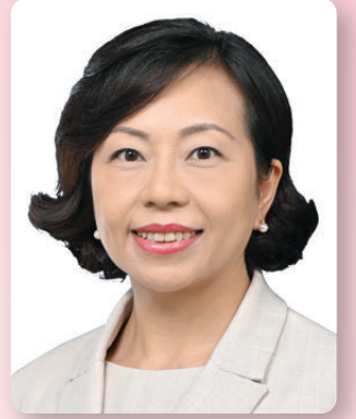
民政及青年事務局局长 麥美娟SBS太平紳士