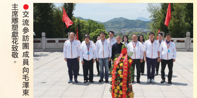
●交流參訪團成員向毛澤東主席雕塑獻花致敬。

隨後，僑界青年深入革命老區龍岩，走進被譽為「紅軍長征第一村」的長汀縣中復村。在觀壽祠前，聽着「父送子、妻送郎」的動人故事，青年們沿着紅軍當年的足跡，邁出「重走長征路」的步伐。交流參訪團亦前往上杭縣古田鎮參訪古田會議會址，深刻體會革命先輩探索前行的堅定信念，並向毛澤東主席雕塑獻花致敬。此外，一行人還實地參觀了由愛國華僑在龍岩創辦的德熙酒廠，了解其發展與釀造工藝。