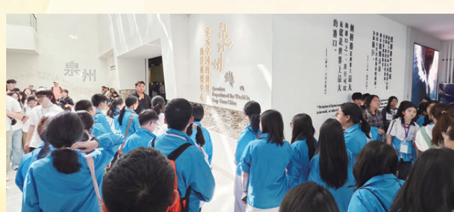
●團員參觀海外交通史博物館。

此次「紀念長征勝利90周年僑青閩地行」的核心要義，不僅在於回望歷史，更在於將希望寄予青年。作為香港僑界新生代，青年們既了解內地國情，又具國際視野。讀懂了百折不撓的「長征精神」、愛國愛鄉的「嘉庚精神」與同根同源的「閩台文化」，青年一代必將凝聚成青春奮進的磅礴力量，走好屬於他們這一代人的「新時代長征路」。