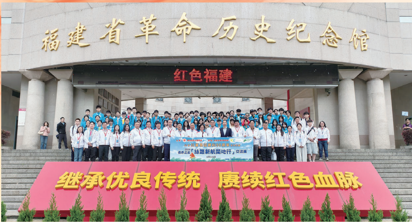
●交流參訪團參觀福建省革命歷史博物館。

今年是紅軍長征勝利90周年，這段波瀾壯闊的歷史，見證了中國共產黨帶領人民自強不息的奮鬥歷程。今年亦是國家「十五五」規劃開局之年，在推進中國式現代化、發展新質生產力的歷史進程中意義重大。為傳承紅色基因、厚植家國情懷、促進閩港交流，由香港僑界社團聯會（港僑聯會）主辦、香港民政及青年事務局及青年發展委員會資助的「紀念紅軍長征勝利90周年系列活動——香港僑青重走長征路暨『2026紀念長征勝利90周年僑界之友絲路新航閩地行』交流團」及參訪團，於4月2日至6日赴福建開展為期5天的交流活動。逾百名香港中學師生及僑界青年走訪福州、龍岩、泉州、廈門四城，在紅色足跡中感悟革命精神，在海絲文化裏探尋歷史脈絡。