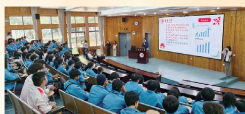
●華僑大學為交流參訪團的香港青年準備了主題宣講。

在泉州華僑歷史博物館，一張張海外僑批勾勒出華僑先輩漂洋過海、艱苦創業的壯闊畫卷。樂善堂梁鍊書的吳秉哲深表示：「先輩們身在海外卻始終心繫祖國的愛國情懷，是我們這一代必須傳承的寶貴精神財富。」行程最後，交流參訪團抵達廈門，參觀了陳嘉庚紀念館與集美鰲園。香港青年們循着史料脈絡，讀懂了被譽為「華僑旗幟、民族光輝」的陳嘉庚先生的一生。全體團員在集美解放紀念碑前肅立，並於陳嘉庚先生陵墓前致敬，接受了一次深刻的愛國主義教育。