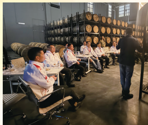
●團員實地參觀德熙酒廠。

期望他們能成為中國與世界溝通的「青年使者」，把在福建見到的紅色傳承、海絲文化及發展成果，用世界聽得懂的语言分享出去，講好中國故事，在民族復興的偉業中擔當重任。