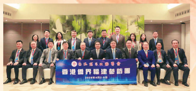
●福建省委統戰部會見香港僑青交流參訪團一行。

4月2日，交流參訪團抵達福建首日，福建省政協副主席、省委統戰部部長林文斌在福州會見了交流參訪團一行。雙方圍繞傳承長征精神、深化閩港青年交流、共促高質量發展進行了座談。林文斌對交流參訪團表示歡迎，肯定了港僑聯會長期以來為維護香港繁榮穩定及支持福建發展所作的貢獻。他指出，今年是紅軍長征勝利90周年，港僑聯會以此為契機組織青年回閩交流意義重大，希望香港年輕一代發揮所長，在服務閩港合作、助力兩岸融合發展示範區建設上實現共贏。