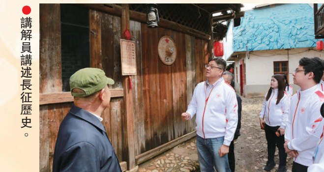
●講解員講述長征歷史。