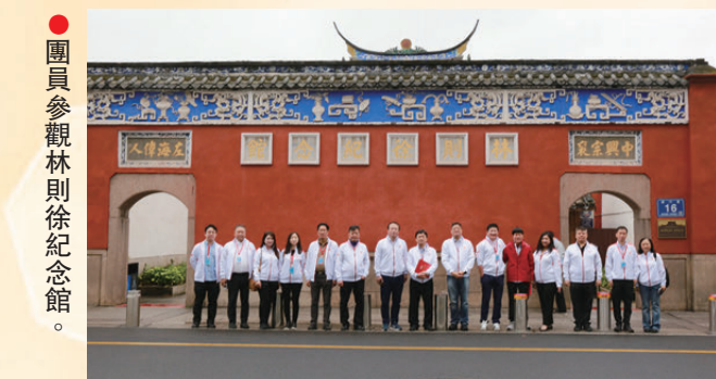
●團員參觀林則徐紀念館。