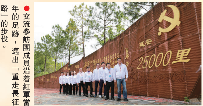
●交流參訪團成員沿着紅軍當年足跡，邁出「重走長征路」的步伐。