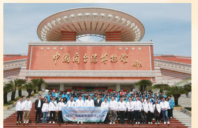
●交流參訪團參觀中國閩台緣博物館。

4月4日至5日，交流參訪團在古田海上絲綢之路起點泉州，參觀了海外交通史博物館、泉州西街與開元寺，沉浸式感受千年刺桐城的海絲情懷。而此次行程中另一深具意義的一站，是參觀中國閩台緣博物館。館內豐富的展品生動展現了閩台之間不可分割的血緣與文緣，讓香港青年們深刻理解兩岸同根同心、一家親的歷史底蘊。