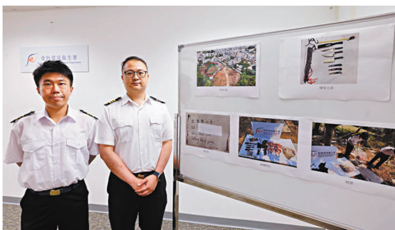
●食環署向傳媒交代案情及展示行動中拍攝的圖片。

香港文匯報訊 (記者 蕭景源) 食物環境衛生署根據線報及經調查，包括出動無人機進行監察搜證，於前日(16日)聯同警方在元朗錦田一個農場拘捕一名正在非法屠宰羊隻的67歲男東主，即場檢獲7.4公斤羊肉及羊內臟，市值約3,000元，同時檢獲一批涉案的屠宰工具。食環署相信已成功搗破一個最近才運作的無牌屠宰場。涉案東主已被落案起訴涉嫌無牌經營屠場、非法屠宰食用牲口及出售禁售食物等相關罪名。