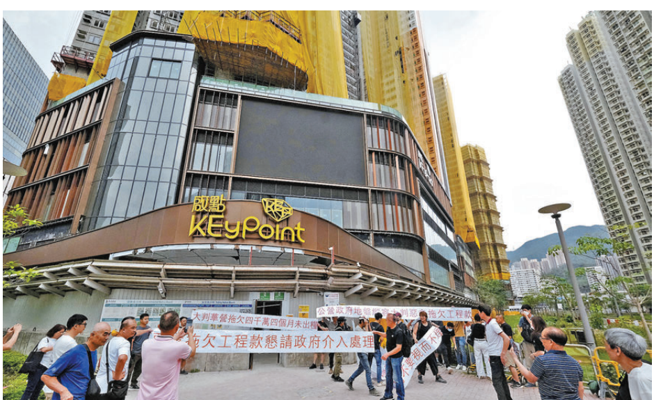
●房協一個用地項目出現欠薪風波。

另外，有商戶聯同義能聯合會向居民借出外骨骼機械裝備，以減輕居民上樓的體力負擔，而居民在借用前須於區內其他屋苑後樓梯進行體能測試。義能聯合會昨日透過社交平台表示，收到前法團成員的提醒，指在社區公共空間，特別是樓梯等特定場地進行此類科技設備測試時，應更加嚴謹地審視安全配套設施及使用權限，以避免潛在風險。經過評估，該會認為原定場地的樓梯並不適合用作外骨骼測試用途，決定即時暫停所有相關測試活動，並正全力尋找更合適、更安全的替代場地及解決方案。