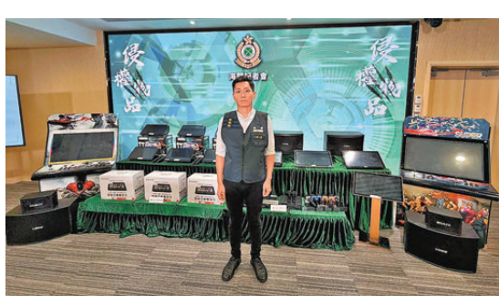
●海關人員在荔枝角搗破的派對房間內部情況。