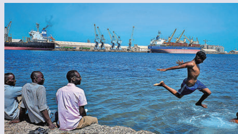
●青年在紅海蘇丹港跳水，背景可見數艘貨船。