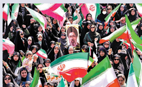
●德黑蘭婦女手持伊朗國旗和最高領袖穆傑塔巴畫像遊行。