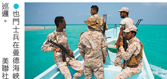
●也門士兵在曼德海峽巡邏。

香港文匯報訊 伊朗伊斯蘭革命衛隊17日發文警告稱，已向事關紅海航運通行的曼德海峽內所有商業與軍事船隻，發出嚴厲且前所未有的警告，要求