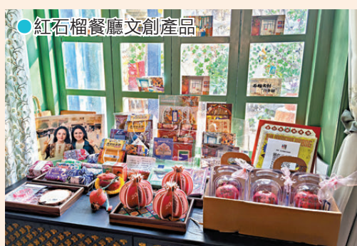
●紅石榴餐廳文創產品

《紅石榴餐廳》作為一部聚焦新疆都市生活、抒寫民族團結與人間真情的誠意之作，以細膩鏡頭捕捉市井日常，把一家小店的悲歡與堅守、一群人的守望與相助，融入烏魯木齊的晨光暮色之中。劇中暖黃色的燈光、充滿民俗風情的陳設、香氣四溢的新疆美食，以及鄰里間熱絡的寒暄、陌生人之間的善意，都讓觀眾對這座邊城心生嚮往。作為核心取景地的紅石榴餐廳，原本只是劇組搭建的二層鋼結構臨時布景，卻因觀眾的熱烈期待，在水磨溝區多部門聯動推進下，完成了從「虛擬場景」到「實景文旅空間」的蝶變。