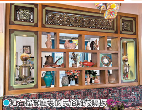
●紅石榴餐廳裏的民俗雕花隔板