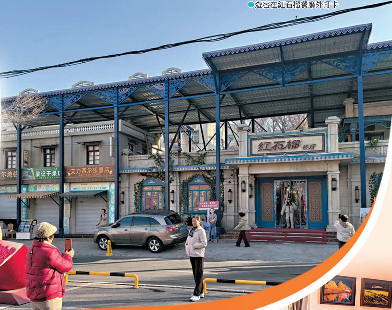
●遊客在紅石榴餐廳外打卡