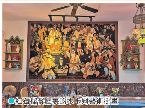
●紅石榴餐廳裏的木卡姆藝術掛畫