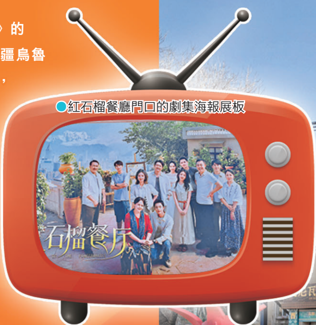
●紅石榴餐廳門口的劇集海報看板