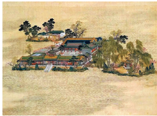
●《圓明園四十景》(局部)

的陳設，在這三間不大的房間，我還看到了中國宮廷瓷器、地毯、牆壁上的繪畫、乾隆皇帝的御璽，還有來自新疆的和田玉器、北京的掐絲琺瑯器、福建省作為非遺傳承的大漆屏風等。其中有我最喜歡的宮廷瓷器：琺瑯彩瓷！這是唯一在清朝時期於宮廷裏燒製完成的稀世珍品！還有一些文物甚至被改造成檯燈或其他裝飾用品，望之心痛。 第二，法國還保存了一套《圓明園四十景》，絲綢質地的絹本彩繪，是由清代宮廷畫師唐岱、沈源繪製的圓明園全景圖。這是目前全世界範圍內公認的研究圓明園原貌最權威的資料，現藏於法國國家圖書館（BnF）。乾隆皇帝在每一幅畫面上都題寫了一首詩，畫中的題目和詩詞代表着他對治理天下的期待，比如在「正大光明」的圖景裏他寫着：「青草思示儉，山靜體依仁。洞達心常豁，清涼境絕塵。」字裏行間流露着他心中的理想生活。如果您有興趣看這些繪畫，法國國家圖書館已經將它們數字化發布在網絡上。期待它們早日歸國的那一天。 第三，那就是著名的十二生肖獸首：其中牛、虎、猴、豬、馬、鼠、兔七尊獸首已通過回購、捐贈等方式回歸中國，現藏於北京保利藝術博物館和國家博物館等地。龍首據傳聞密藏在中國台灣，其餘四尊仍下落不明。其中鼠和兔首是法國皮諾家族在法國購買後捐贈歸國。那還有哪些流失的中國文物在法國呢？我們下期再講！