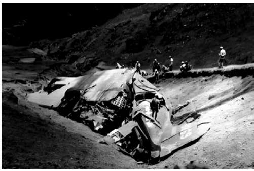
●駝峰航線下的美軍飛機殘骸。

明運送汽油、棉紗和炮彈。機群在飛越橫斷山脈以西原始森林上空時，突然遭到30多架日軍戰鬥機的襲擊。美軍運輸機只有一架在護航飛機掩護下倖倖逃脫，其餘13架均被擊落或撞山，機組人員無一生還。 鑒於經過緬甸北部的駝峰航線時刻處在日本飛機的威脅之下，史迪威建議美軍司令部開闢一條從中國四川成都，經青藏高原飛越喜馬拉雅山，直達印度汀江的航線。喜馬拉雅山脈橫跨中國、尼泊爾、印度、不丹、巴基斯坦等國。從地理上看，在中國的後方機場中，離印度最近的基地只有兩座，一座在昆明，另一座在成都。它們相互的位置猶如一隻等邊三角形，端點在印度汀江機場，一條直線經西藏到成都，另一條直線則經過緬甸到昆明。而飛越這條航線的最大敵人是號稱「世界屋脊」的喜馬拉雅山脈。 美軍駝峰航線空運司令部決定在1942年8月試飛這條航線，他們選定的試飛主駕駛是美軍中大名鼎鼎的「空中冒險家」斯科特上校。斯科特與史迪威是老相識，曾於當年5月初奉命駕機到緬北營救史迪威。試飛的飛機是美國空軍「3-317」號飛機，代號「兀鷹」。這是一架當時美軍大中型飛機中最先進的全天候機種C-47運輸機。斯科特上校駕駛「3-317」號飛機在1942年8月的一個早上從成都太平寺機場起飛。起飛前盟軍中緬印戰區美軍總司令史迪威在美軍駝峰航線空運司令比爾斯少將和飛虎隊陳納德少將陪同下登上「3-317」號飛機，為斯科特上校送行，祝他試飛成功。 史迪威和比爾斯少將、陳納德少將在「3-317」號飛機起飛後一直在機場塔台指揮室緊密關注飛行情況，塔台話務員每隔3分鐘和「兀鷹」聯繫一次，繪圖參謀用一支鉛筆在航空地圖上不斷繪出一條向西延伸的坐標紅線來。比爾斯和陳納德不時小聲交談，參謀軍官不停報出各種數據，導航員不時衝着話筒高聲叫嚷，電台發出的脈衝信號忽高忽低、嘈雜刺耳。史迪威對身邊的一切似乎都