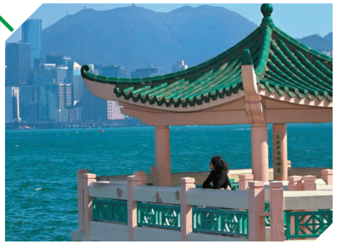
海心公園的海心亭。

留着魚尾石與海心石，相傳情侶拜過可求得美滿姻緣。行到飢腸轆轆，不妨到附近品嚐正宗越南風味，飯後再嘗手作迪拜朱古力開心果麻糬，從遊玩到美食，半日正好。