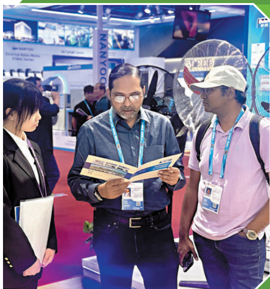
●廣交會現場，境外採購商正在了解中國產品。