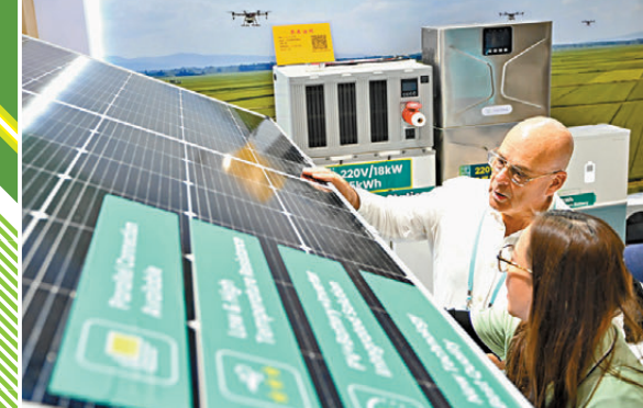
▲境外採購商挑選新能產品。

「相比傳統能源，儲能系統在綜合成本控制方面具備明顯優勢，我們在新興市場的訂單規模與產品開發能力也實現快速突破。」針對海外儲能市場需求，