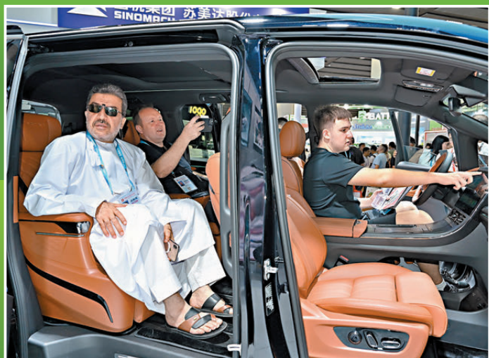
▲境外採購商體驗廣汽M8新能汽車。