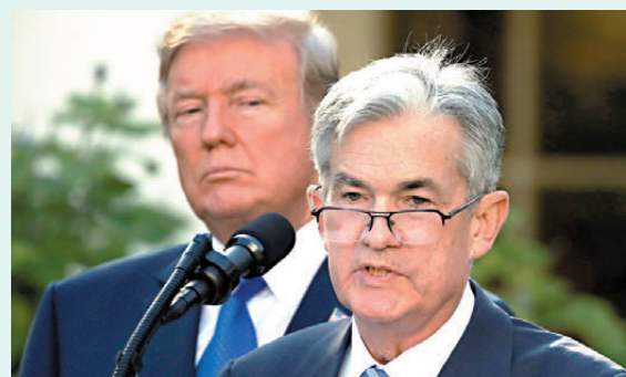
●美聯儲主席鮑威爾大概率在5月中旬任期屆滿後繼續擔任臨時主席一職，直至沃什最終得到國會確認。

將原定上週舉行的美聯儲主席提名人沃什的聽證會，延期至本週二（21日）舉行，沃什團隊正力爭盡快提交聽證會所需相關材料。白宮經濟顧問哈賽特回應，對沃什5月履新美聯儲主席「高度有信心」。