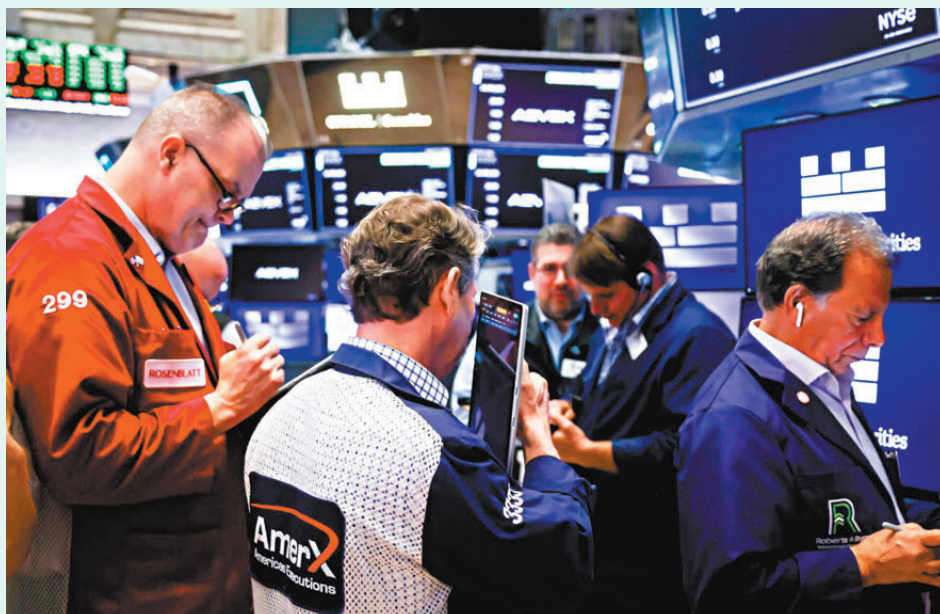
●華爾街分析師指，鑒於美伊衝突尾部風險暫未褪去，短期切忌掉以輕心。 彭博社