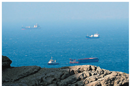
●伊朗宣布開放霍爾木茲海峽通航後，油價顯著被壓低。

香港文匯報訊（記者 倪巍晨 上海報道）伊朗早前宣布「開放霍爾木茲海峽通航」的消息重挫油市。隔夜WTI原油（USCL）收報每桶85.56美元，跌幅8.18%，上週累跌10.52%；布倫特原油（BOIL）收報每桶92.08美元，當日振幅約14%，全周振幅18.85%。分析稱，霍爾木茲海峽承擔全球約五分之一的石油運輸，前期海峽航運中斷風險，令國際油價計入較多「戰爭溢價」。海峽商業通航的重開，被市場視為「地緣局勢