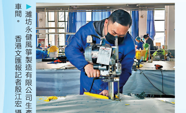
▲濰坊永健風箏製造有限公司生產車間。