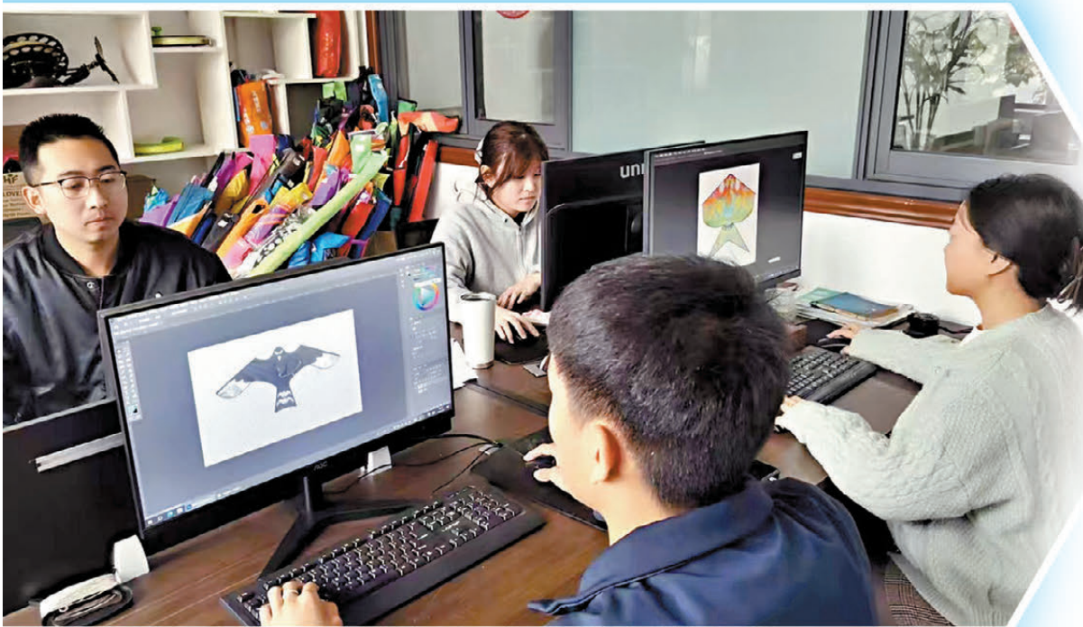
●濰坊永健風箏製造有限公司年輕的設計團隊為風箏加入流行元素。

在濰坊世界風箏博物館，「濰坊風箏紀」VR體驗、「龍箏繪夢」MR大空間體驗項目一推出便受到觀眾的熱捧。該項目由濰坊世界風箏博物館和當地龍頭科技企業歌爾創客公司聯合打造，遊客通過可穿戴設備實現虛實交互，穿越千年時空親手「觸摸」傳統風箏紮製技藝，沉浸式體驗古濰縣年畫觀賞、打鐵花表演、市井叫賣等經典民俗場景，打造多感官非遺敘事空間。與此同時，博物館還啟動館藏風箏數字化工程，建立綜合性數字化資源庫和線上展示平台，觀眾可掃碼進行3D觀看，以創新方式傳播濰坊風箏非遺文化。這種傳統非遺與數字潮流的碰撞，讓「萬物皆可上天」的濰坊傳奇，不斷刷新大眾的想像邊界。