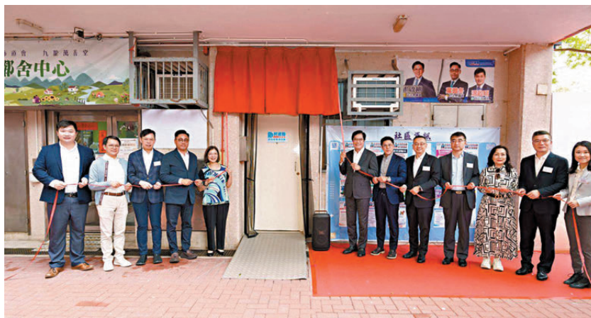
●位於將軍澳厚德邨德澤樓地下的霍啟剛立法會議員、民建聯葉傲冬立法會議員及溫啟明區議員聯合辦事處昨日舉行開幕典禮。