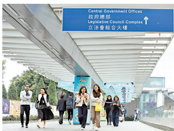
●公務員事務局局長楊何蓓茵表示，部門首長責任制未有規管常任秘書長，但調查中若發現其牽涉在內會作調查。圖為政府總部外行人天橋。