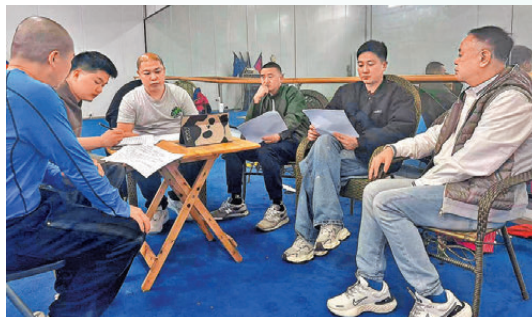
●川粵兩方的演員一年多來不斷跨境商討演出技術及內容。