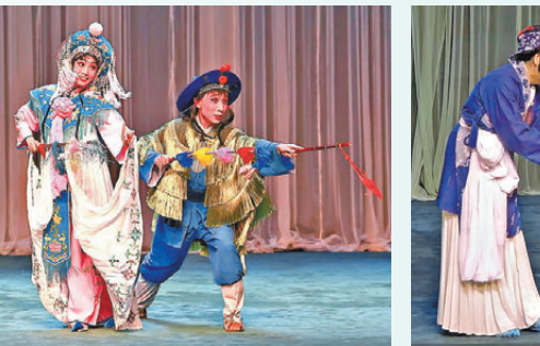
●昆腔《小放牛》演出風趣，具生活情景。