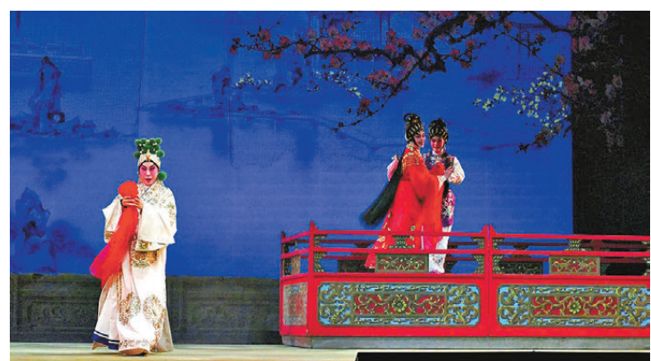
▲《亂世胡漢情》藝青雲歡天喜地拾得繡球。