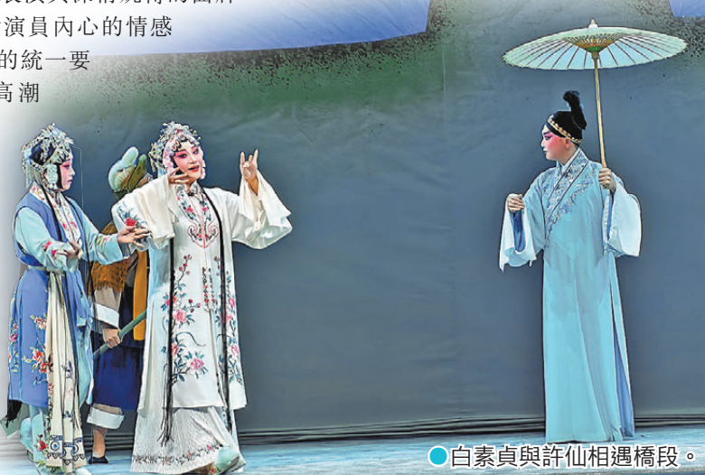
●白素貞與許仙相遇橋段。