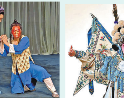
●《望娘灘》有特別的「吹臉」演出。