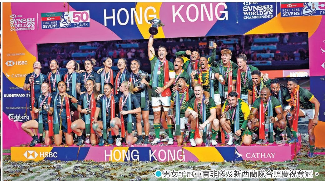
●男女子冠軍南非隊及新西蘭隊合照慶祝奪冠。

今年香港七欖適逢50周年誌慶，煞科日繼續吸引大批球迷入場朝聖。天公造美下，啟德主場館昨日打開天幕迎客，七欖最著名景點南看台在陽光照耀下氣氛更加熾熱，中午12時30分二樓觀賽區已達人數上限。