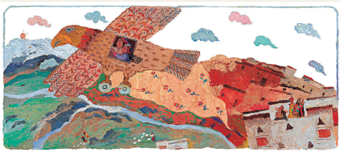
● 蔡皋作品激發孩子們的想像。