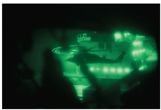
●美軍陸戰隊員乘坐直升機飛抵貨船上空。

報道明確指出，伊朗已為重新開打的可能性做好充分準備，一旦戰火重燃，基礎設施將成為攻擊目標，伊朗將徹底放棄此前在曼德海峽以及對沙特阿美、沙特延布重工業園區、阿聯酋富查伊拉港等周邊國家能源企業和設施所保持的克制。伊方判斷重新開打的可能性高於繼續談判，一旦衝突再度爆發，將會讓對方經歷永生難忘的「地獄時刻」。