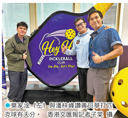
●莫家淦(左)與潘梓峰讚黃日華打匹克球有天才。

香港文匯報訊(記者子棠)莫家淦和潘梓峰與友人合資7位數開設的的匹克球場Pickleball Club昨日正式開張，獲黃日華、趙浚承、周志康、黃建東、葉泓聲等多位圈中人到賀。黃日華更笑言為二人獻出了打匹克球的第一次，但說到夾份做生意，就自嘲「搭沉船」拒投資。莫家淦和潘梓峰兩位老闆更指喜見友台藝人也有來打球，證明運動無疆界。 莫家淦與潘梓峰表示球場實施24小時營業，方便上班人士打球，由於去年11月開始試業，雖未回本，但第一個月已收支平衡，並看好這項運動的熱潮將持續下去，計劃在不同地區增設分店。黃日華亦有大讚二人選址眼光好，交通便利，自己也在這裏奉獻上打匹克球的第一次，全靠兩位老闆指點，又笑謂：「佢哋教波唔惡，因為唔夠我惡，哈哈。」莫家淦與潘梓峰也大賣口乖，稱讚黃日華打匹克球很有天分和潛質，並且日跑步體力好，最重要的是有型。 說到大家互相欣賞，會否考慮一起投資分店？黃日華連忙搖頭：「不會，我會搭沉船。其實我屬於穩健型，不會做生意的，但朋友有需要時我可隨傳隨到，亦會帶朋友來打球，幫他們宣傳。」 潘梓峰透露曾接到顧客預訂場地的來電，詢問「姜濤會不會來打球」；莫家淦解釋之前曾邀請一位ViuTV主播到場試玩，沒想到對方竟帶了姜濤同行，可能因球場提供24小時營業及高私密度的環境，方便球友隨時來玩。兩位老闆續謂，不過姜濤僅來過一次，會否再來就隨緣，不會刻意邀對方再度現身支持，以免像借人做宣傳似的，但很開心不單止音樂無疆界，運動也是，喜見友台ViuTV和HOYTV藝人也有來打球。