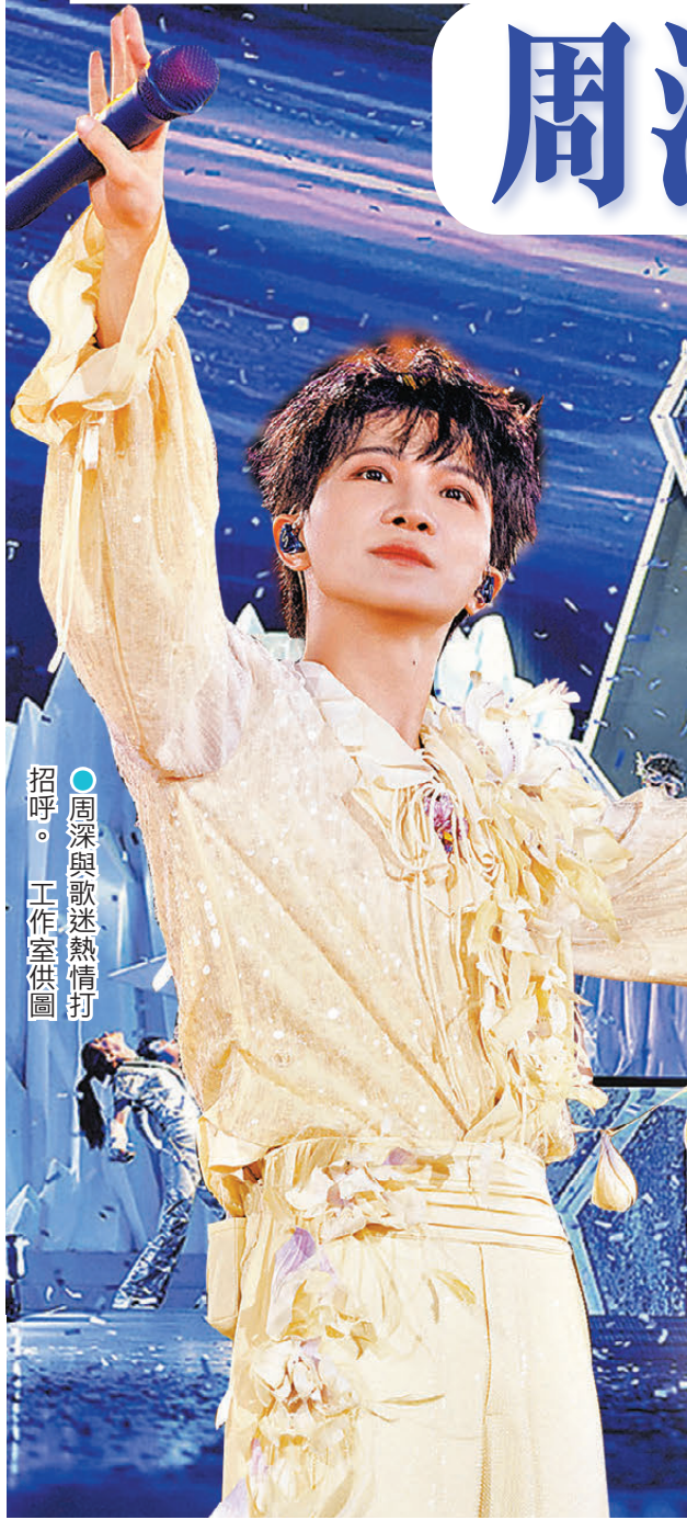
周深與歌迷熱情打招呼。

從香港跨年場到廣州首站，周深在「深深的」舞台也不斷敞開自己，積極接收台下歌迷投遞的炙熱愛意。當《地球沒有你》的旋律一起，周深眼眶深紅，一度哽咽到失聲。許多歌迷也一併入情，紛紛跟着哼唱成「小哭包」。當演唱會成為情感雙向奔赴的能量場，正如不少歌迷感嘆：唯有愛讓歌聲不止，熱愛不息，我們在音樂的陪伴中不斷啟程和到達。