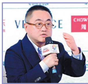
張冀說真正考驗編劇創作的永遠是人物。