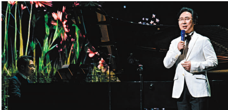
廖昌永深情演繹《月滿西樓》。