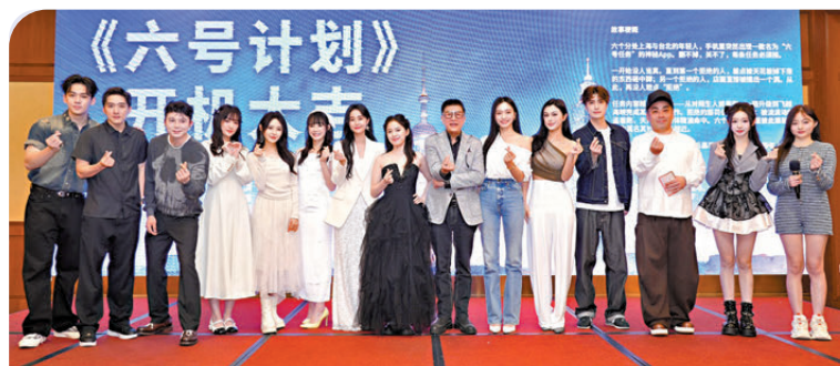
首部兩岸合作短劇《六號計劃》正式開機。