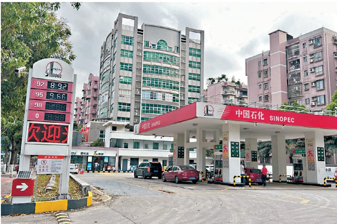
●國際油價震盪下降，內地油價今年以來首次下調。圖為廣州的一座加油站。

4月7日24時，國家發展改革委再次啟動調控措施。彼時國際油價仍處於震盪高位，按機制計算汽、柴油價格每噸應分別上調800元、770元，調控後實際每噸上調420元、400元，每噸少漲380元、370元，折合92號汽油每升少漲0.31元，進一