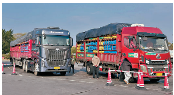
●油價下調直接降低了居民出行與物流運輸成本。資料圖片

據國家發展改革委價格監測中心監測，本輪成品油調價周期內，即4月7日24時至4月21日24時，國際油價震盪下降。因此，在4月21日24時開啟國內成品油調價窗口。據悉，本輪調價為年內第八次調價窗口，也是今年以來的首次下調。