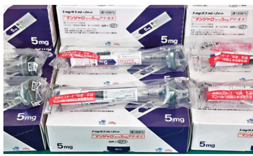
●海關行動中檢獲減肥針劑及美容針劑。

香港文匯報訊(記者 蕭景源)香港海關由今年1月下旬起，透過風險評估和情報分析加強打擊受管制藥物和針劑的執法力度，先後於3月底及4月初偵破兩宗相關案件，合共檢獲2.06萬支減肥針劑、1.1萬支美容針劑及超過413萬件藥劑製品，市值約4,000萬元。海關指當中大部分藥物需要特別冷藏保存，但發現該些藥物時均未有冷藏處理，健康及藥效成疑。行動中拘捕3名涉案男女。