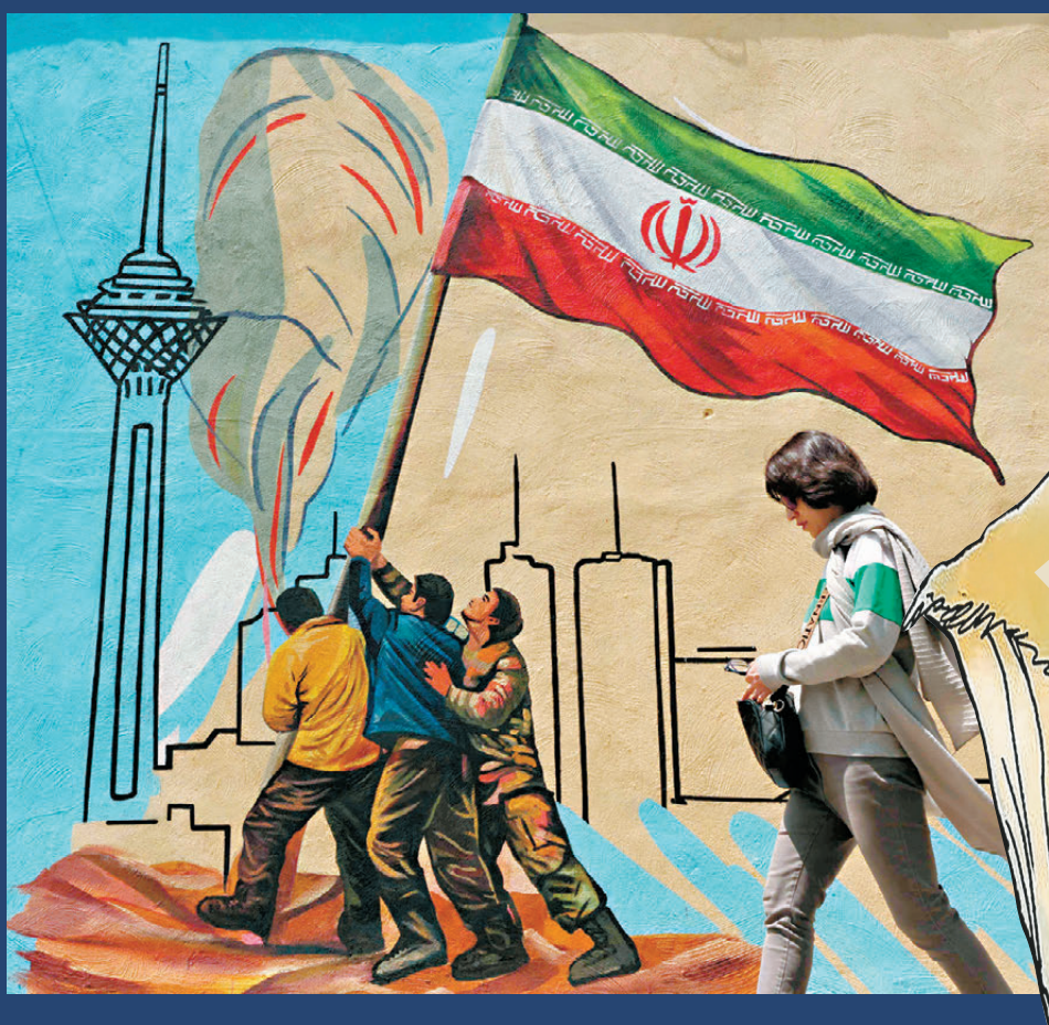
●一名伊朗婦女在德黑蘭走過一幅反美壁畫。

香港文匯報訊 美國總統特朗普4月20日宣稱，美國和伊朗新一輪談判定於巴基斯坦首都伊斯蘭堡當地時間21日開始，副總統萬斯將作為美方代表前往巴基斯坦。美國與伊朗的停火期限將於美東時間22日晚間到期，美媒披露特朗普並打算延長期限。伊朗外交部表示，伊方將綜合評估各方面因素，決定下一步行動方向。伊媒稱截至當地時間21日，伊朗沒有任何代表團前往伊斯蘭堡。