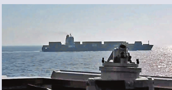
●美軍19日在阿曼灣襲擊伊朗貨船。

香港文匯報訊 伊朗外交部21日發表聲明，強烈譴責美軍19日在阿曼灣襲擊伊朗貨船，要求美國立即釋放被扣押船隻及船上人員。聲明批評稱，美方襲擊伊朗貨船、將船上人員扣為人質是海盜行為和恐怖主義行徑，是又一次公然違背兩國停火共識，可被視為對伊朗的侵略。聲明警告美國，襲擊伊朗貨船可能帶來非常危險的後果：「顯而易見，地區局勢進一步複雜化的全部責任都在美國。」