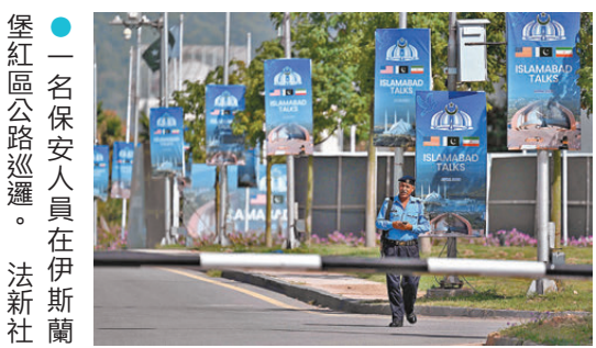
●一名保安人員在伊斯蘭堡紅區公路巡邏。

阿拉格齊亦與俄羅斯外長拉夫羅夫通電話。阿拉格齊表示，伊朗將密切關注相關動向，在維護國家利益和安全基礎上作出必要決策。拉夫羅夫表示，俄方強調須在經巴基斯坦方面協調、各方先前贊同並已公布的條件下保持停火，各方要繼續付出外交努力，防止局勢失控升級乃至武裝對抗再起。