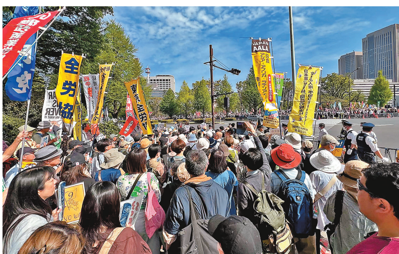
●大批示威者19日聚集在東京國會大樓外，聲援日本的和平憲法。