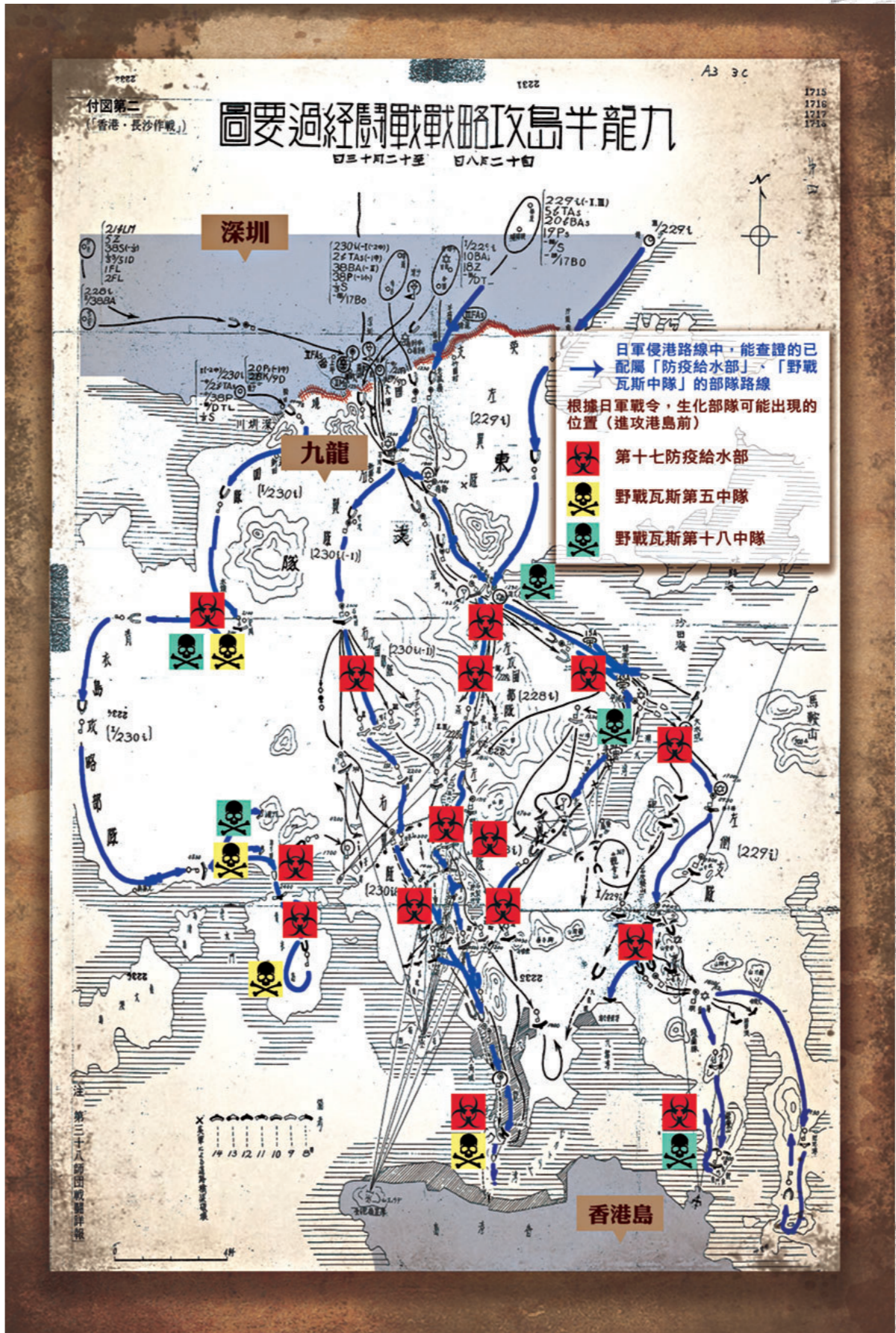
●日軍生化部隊進攻香港路線

現藏日本防衛研究所，由佐野忠義簽發的《沼作命甲第20號(12月8日攻圍有關師團命令)》文件顯示，日軍在進攻青洲時，於左、右翼進攻部隊和左側支隊配屬了「第十七野戰防疫給水部」和「野戰瓦斯第五中隊」、「野戰瓦斯第十八中隊」；同藏日本防衛研究所的《伊支作命甲第7號(關於12月8日支隊攻擊的命令)》顯示，隸屬佐野忠義第三十八師團的伊東支隊，在當日的作戰中也分別於直轄部隊、迂迴隊、左翼隊、右翼隊分別配屬了「第十七野戰防疫給水部」一部，其中直轄部隊還加強配屬了「野戰瓦斯第十八中隊」。