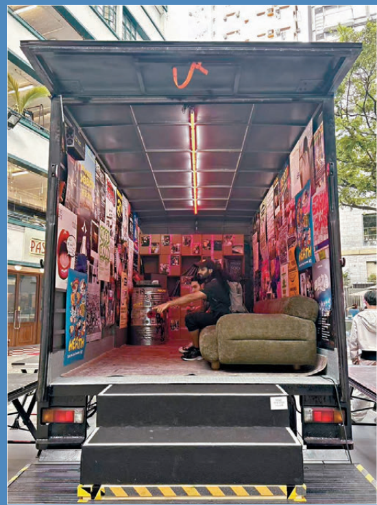
●藝術貨車內部別有洞天。