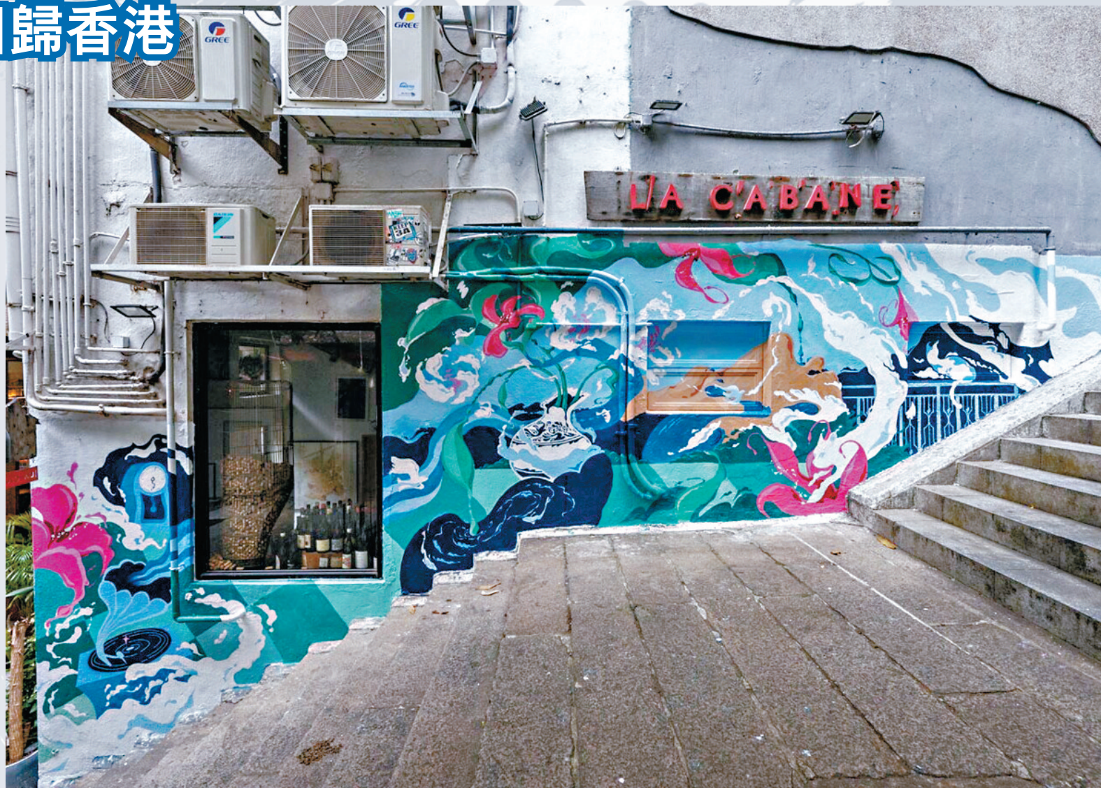
●本地插畫家 Enoch 在中上環荷李活道一帶完成了自己的壁畫作品。