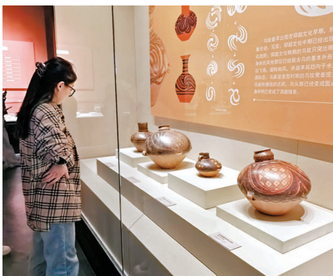
●展覽呈現不同時期的彩陶文明。

春風拂天山，彩陶越千年。4月10日，《從黃河到天山——史前彩陶的西漸之路》文物大展在新疆維吾爾自治區博物館正式開幕。甘肅新疆兩地 15 家文博機構聯手，集結 175 件（組）珍貴彩陶文物，把跨越 4,000 餘年、綿延數千公里的「彩陶之路」完整呈現在觀眾眼前。