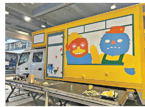
●「Art on the Move 藝術貨車」的外觀具創意性。

本屆 HKwalls 街頭藝術節創作陣容鼎盛，邀得來自 14 個國家的超過 20 位頂尖藝術家雲集香江，展開為期 9 日的街頭創作之旅。藝術家們走遍中環蘇豪區、半山區、上環及西營盤等特色街區，在建築外牆、店舖鐵閘、鐵皮屋攤位與社區庭園等多元戶外空間，揮灑創意、繪製大型壁畫。