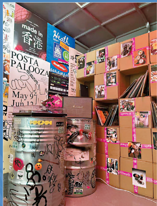
●貨車內擺放音響與黑膠碟等裝置，觀者可以自行選擇在車廂中聽音樂。