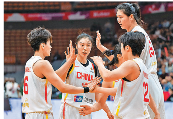
●中國女籃於世盃分組賽遇衛冕冠軍美國隊。資料圖片

香港文匯報訊 據新華社報道，2026女籃世界盃正賽小組賽階段分組昨日(22日)進行抽籤，上屆亞軍中國女籃抽得下籤，將與衛冕冠軍美國隊在D組相遇，同組還有捷克隊和意大利隊。