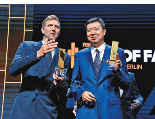
●王治郅(右)在名人堂儀式上與魯域斯基合照。

中國籃協以賀信形式向王治郅表示祝賀。信中提到王治郅在國內外賽場取得的成績，體現了一代中國籃球人的拼搏與堅守。願新一代年輕運動員以前輩們的奮鬥為矩，照亮自己的征途，傳承中國籃球的精神火種。