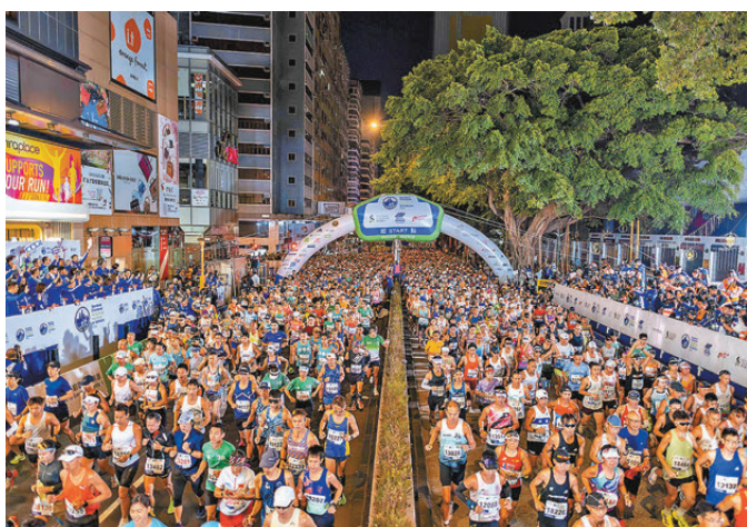
●今屆渣馬為香港帶來高達3.38億元經濟效益。

香港文匯報訊 渣打香港馬拉松大會昨日(22日)發售環境、社會及管治(ESG)報告，顯示賽事透過本地及非本地跑手消費，為香港帶來的經濟效益高達3.38億港元；同時為多間慈善機構共籌得近1,500萬港元善款。