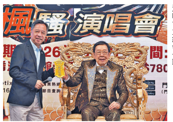
●胡楓欽點資深傳媒人何麗全擔任演唱會大統領職。

香港文匯報訊(記者 余雁)胡楓(修哥)縱橫藝文圈超過七十載，創造無數傳奇，深得大眾尊敬和喜愛。修哥將於6月7日與95歲高齡第六度踏上紅館舞台，舉行《修哥九五至尊無限風騷演唱會》，昨日大會特別安排演唱會記者會公布詳情。