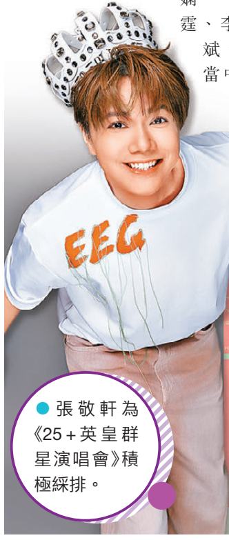
●張敬軒為《25+英皇群星演唱會》積極綵排。