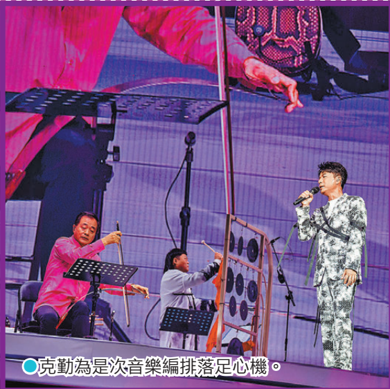
●克勤為是次音樂編排落足心機。